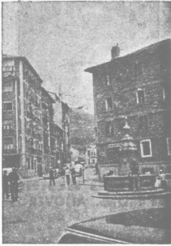
Frente a la fuente de Ibarkurutz, el Casino