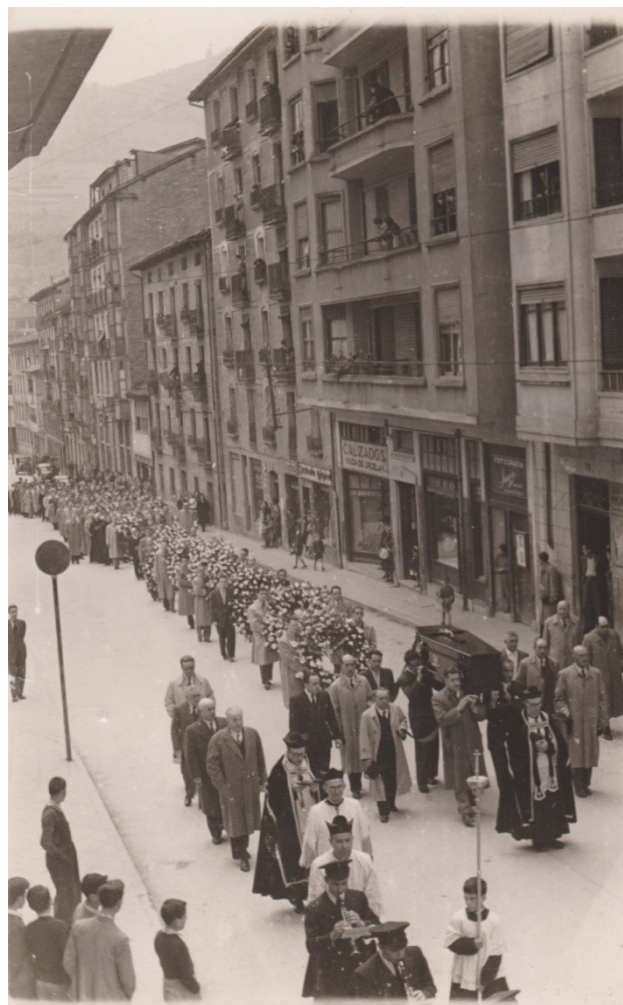
Hileta-egunean, Eibarko kaleetan anderoak zerraldoa eramaten (1951).