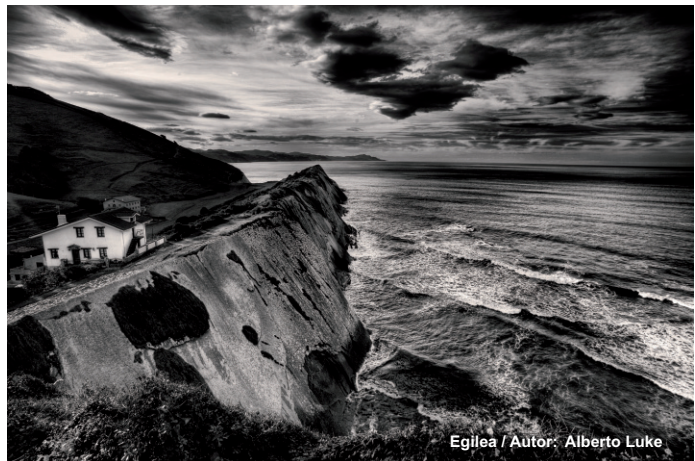
Egilea / Autor: Alberto Luke

KLUB DEPORTIVO ARGAZKITALDEA "Erakusketa Kolektiboa / Muestra Colectiva"