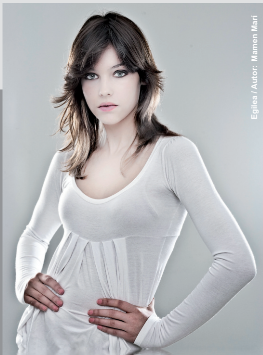
Egilea / Autor: Mamen Marí

UNTZAGA PLAZA Ordua / Horario : 10:00 - 14:00 Asistencia libre