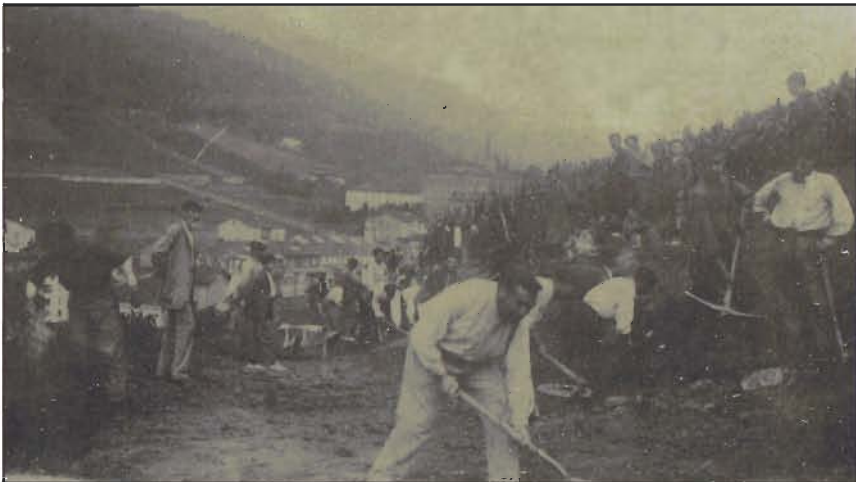
Construcción Carretera de Arrate

en la que la crisis renovada de la industria armera y del pueblo en general resta la capacidad de iniciativa de los eibarreses.