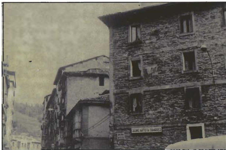
Sede del Casino Artista Eibarrés

Finalmente y haciendo referencia al encabezamiento que hemos elegido para el título: "Inicios y consolidación del Casino Artista Eibarrés (1.912-1.929)", hay que señalar que este título podría entenderse de forma más sencilla si se dividen los años que hemos estudiado en diferentes bloques. De esta manera, podremos observar que los inicios, desde el año 1.912 hasta el año 1.915 es una época digamos "tranquila" por cuanto que es una época en la que la Sociedad asienta las bases de su trabajo y actividad. Luego, nos vamos a encontrar con una etapa de una cierta inactividad, al menos, en lo que se refiere a la organización de acontecimientos. Esta etapa coincidiría con la época comprendida entre los años 1.915 y 1.921. Finalmente, el período comprendido entre los años 1.922 y 1.929 es un período en el que el Casino Artista Eibarrés, poco a poco, va consolidando sus actividades y su organización interna.