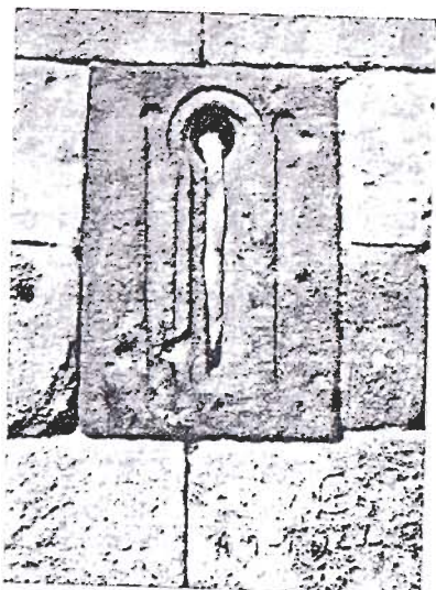
Ventana prerrománica de San Julián de Zaldueño (Alava)