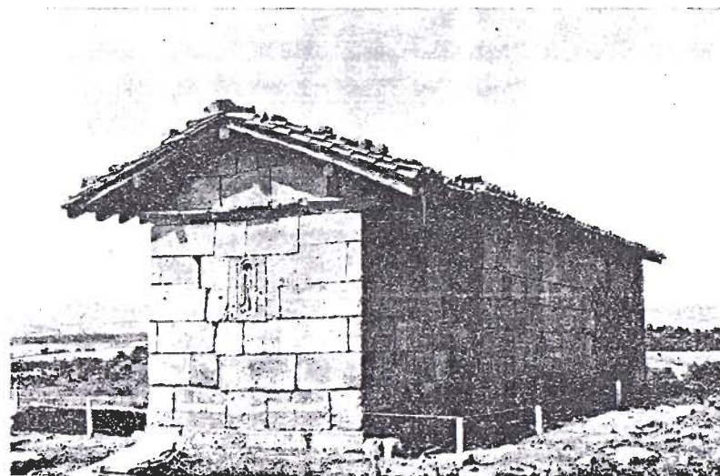
Ermita de San Julián de Zaldueño, lado oriental, recién iniciadas las excavaciones. Agosto de 1979.

Sancristóval me guardaba otra sorpresa en Cicujano. Su iglesia, que es de la advocación de la Degollación de San Juan Bautista, con puerta y cabecera del templo de estilo románico, tiene en el ábside una ventana o saetera con arquillo en forma de herradura que nos recuerda a la de San Vicente del Val, de Burgos, considerada como visigótica y figura en la obra Arte medieval navarro (tomo I, pág. 40) de J. E. Uranga y F. Iñiguez Almech.