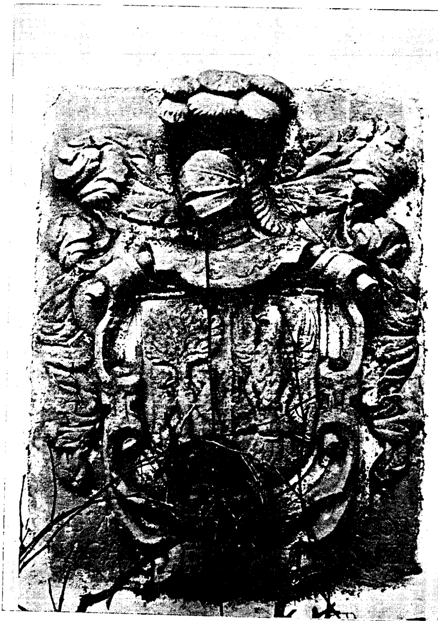
Escudo de armas del caserío Cornuz, en Hondarribia.