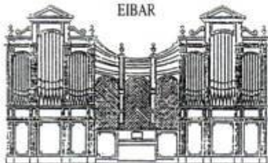
XXVIII SEILU ERAKUSKETA-AZAROAK 23-30