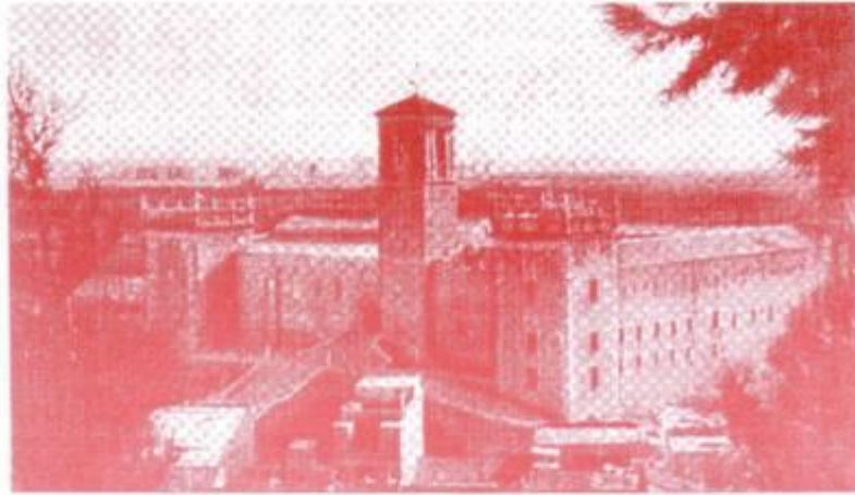
Real Monasterio de Ntra. Sra. del Puig de Santa María