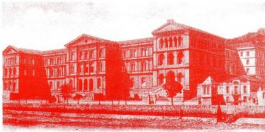
Bilbao — Universidad de Deusto