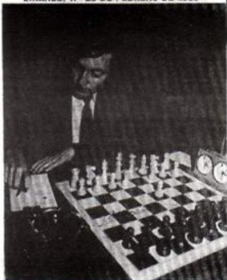
KARPOV Campeón del III TORNEO de AJEDREZ de LINARES en 1981

IV TORNEO INTERNACIONAL DE AJEDREZ LINARES, 11 - 26 DE FEBRERO DE 1983