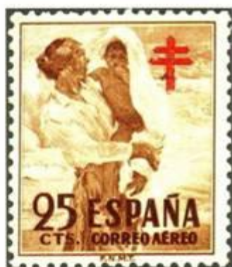
EUSKAL HERRIKO VII. FILATELIA TXAPELKETA