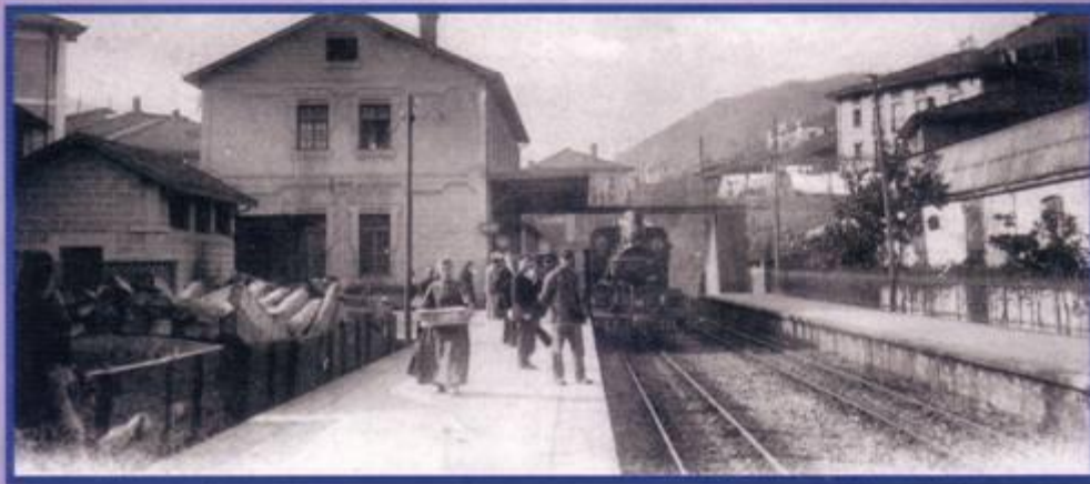
ESTACIÓN FERROCARRIL 19/9/1887

XL. Seilu erakusketa XL Exposición Filatélica