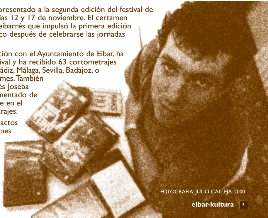
FOTOGRAFÍA: JULIO CALLEJA. 2000

Las proyecciones se desarrollarán en el salón de actos de Portalea entre el lunes 12 de noviembre y el viernes 16 de noviembre. El horario de los pases será de 19.00 a 21.30 horas. La entrega de premios se desarrollará el sábado 17 de noviembre, a partir de las 20.00 horas, en Portalea, con la asistencia de personajes conocidos. El mejor vídeo recibirá un premio de 100.000 pesetas. El premio del público consistirá en 50.000 pesetas.