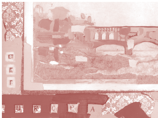
Detalle "1.2 EUROPA" Leire Careaga