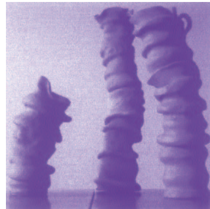
GORUNTZ (25, 35 eta 50x50 zm.)