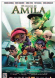
EL SECRETO DE AMILA