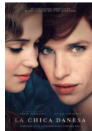
LA CHICA DANESA