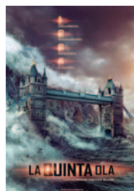
LA QUINTA OLA