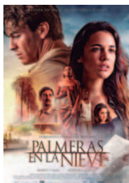
PALMERAS EN LA NIEVE