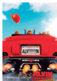
ALVIN Y LAS ARDILLAS 4 FIESTAS SOBRE RUEDAS