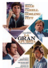
LA GRAN APUESTA