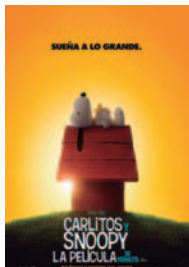
CARLITOS Y SNOOPY