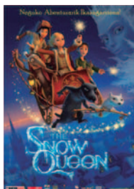
THE SNOW QUEEN

EGITARAUAN ALDAKETAK EGON DAIZTEKE. ORDUTEGI ETA ARETOEI BURUZKO INFORMAZIOA KARTELERAN PROGRAMACIÓN SUJETA A CAMBIOS. PARA HORARIOS Y SALAS CONSULTAR CARTELERA