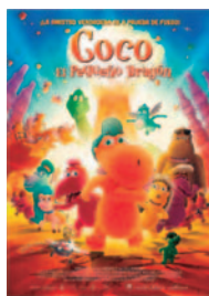
COCO, EL PEQUEÑO DRAGÓN