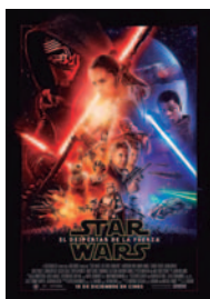
STAR WARS: EL DESPERTAR DE LA FUERZA