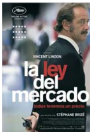
LA LEY DEL MERCADO