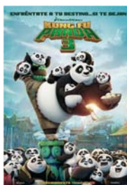
KUNG FU PANDA 3