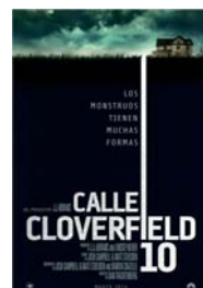
CALLE CLOVERFIELD 10