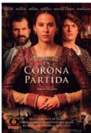
LA CORONA PARTIDA