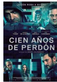
CIENT AÑOS DE PERDÓN