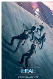
LA SERIE DIVERGENTE: LEAL