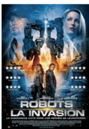
ROBOTS: LA INVASIÓN (EUSKERA)