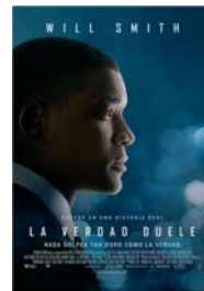
LA VERDAD DUELE

EGITARAUAN ALDAKETAK EGON DAIZTEKE. ORDUTEGI ETA ARETOEI BURUZKO INFORMAZIOA KARTELERAN