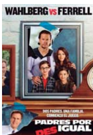
PADRES POR DESIGUAL