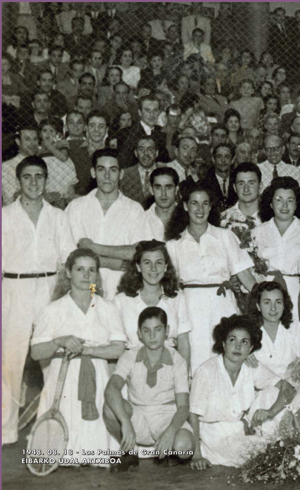
1948. 08. 18 - Las Palmas de Gran Canaria

En ella encontraréis material fotográfico y audiovisual diverso que os permitirá conocer quiénes fueron.