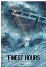
LA HORA DECISIVA