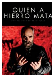
QUIEN A HIERRO MATA