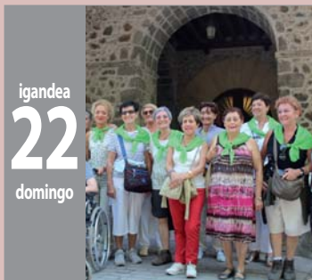
ARRATE IZENEZKOEN JAI FIESTA DE LAS ARRATES jaiak - fiestas