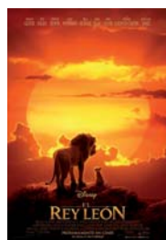
EL REY LEÓN