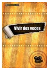
VIVIR DOS VECES