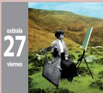
RE_ENCUENTRO erakusketa - exposición