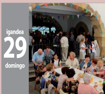
AGIÑAKO JAI FIESTAS DE AGINAGA jaiak - fiestas