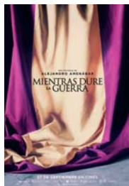
MIENTRAS DURE LA GUERRA