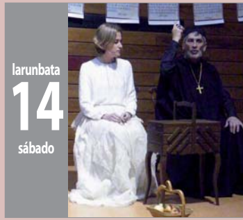
HEREJÍA antzerkia - teatro