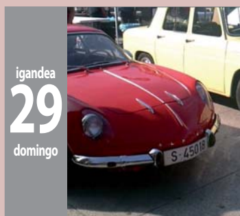
IBILGAILU KLASIKOEN KONTZENTRAZIOA jaiak - fiestas