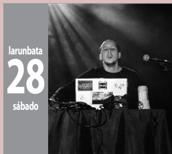
KARRIKAN musika - música