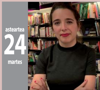
HARIXA EMOTEN liburutegia - biblioteca