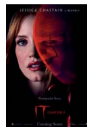
IT CAPÍTULO 2