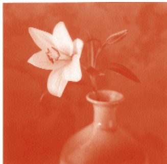
Angel Izpizua - 14-23 mayo Topaleku