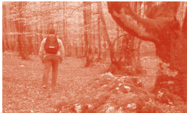
José Luis Feo . Proyección 3D-Esterocopias 15 de mayo - 13,00 h. - Portalea