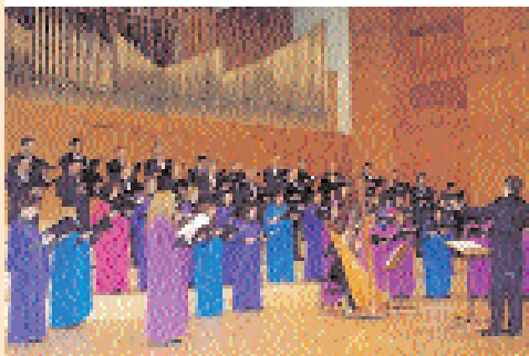
Universitario de San Juan (Argentina)