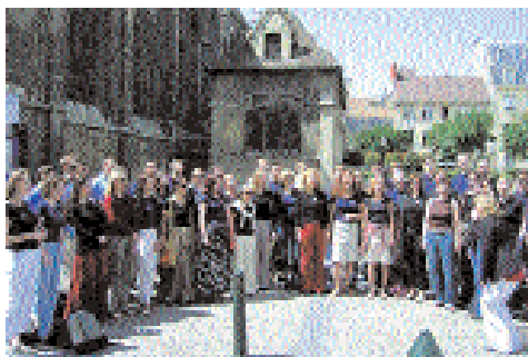
Universitario de Varsovia (Polonia)