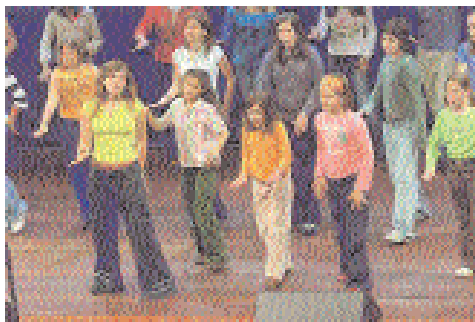
San Cugat (Cataluña)