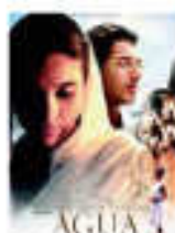
"AGUA" Despa Malitz urtarrilak 18 enero