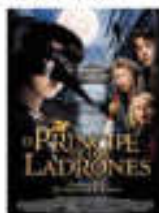
"El príncipe de los ladrones" urtarrilak 14 enero