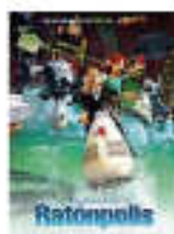
"Ratónpolis" urtarrilak 21 enero