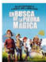
"En busca de la piedra mágica" urtarrilak 28 enero