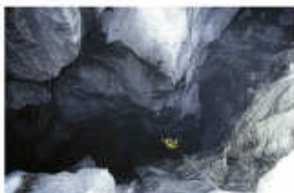
urtarrilak 19 enero, 19:30 - PORTALEA

Antolatzailea Club Deportivo Eibar Organiza