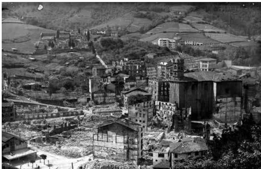
San Andres parrokiaren inguruaren bista.

En el ámbito rural las posiciones más avanzadas de los defensores de Eibar estaban en lugares como el cruce de Málzaga, donde se situaban seis blindados para defender posibles ataques terrestres desde Elgoibar y Soraluze, el