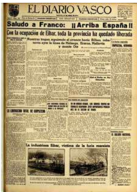
1937ko apirilaren 27ko El Diario Vasco-ren azala. Koldo Mitxelena Kulturuneko hemeroteka.

En 1936 Eibar sufrió un ataque aéreo en agosto, seis en septiembre, nueve en octubre, cinco en noviembre y uno en diciembre, mientras que en los siguientes meses los ataques se detuvieron, hasta que con la ofensiva final franquista iniciada con el bombardeo de Durango el 31 de marzo de 1937 llegó lo peor, cuando Eibar sufrió en abril siete ataques. Y no fueron cualquier tipo de ataques. En los bombardeos existen tres tipos de ataques: Tácticos (Los efectuados sobre tropas), Estratégicos (Sobre empresas, cuarteles, etc.) y por último los de Terror (Buscan causar pánico entre la población y los soldados, y además conllevan producir la mayor destrucción posible y causar un alto número de víctimas mortales), y de ese tipo fueron los de abril de 1937.