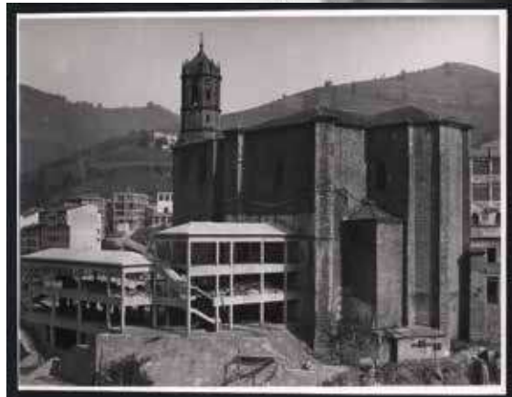
San Andres parrokiari atxikitako eremuak eraikitze lanak. Santa Maria del Villarreko markesa. Administrazioaren Artxibo Orokorra. Construcción de las zonas anexas a la parroquia de San Andrés. Marqués de Sta. María del Villar. Archivo General de la Administración