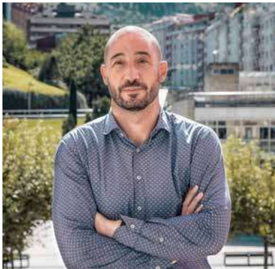
Jon Iraola Iriondo Alcalde de Eibar

La normalidad se está imponiendo, poco a poco, en nuestras vidas, y esto está quedando patente con la recuperación paulatina de los actos festivos que conforman nuestro calendario anual.