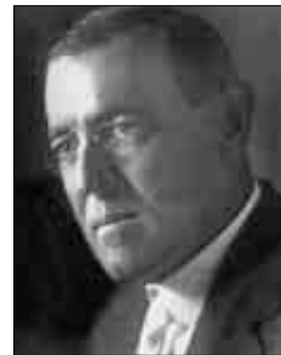
Thomas W. Wilson (1856-1924). El vigesimotercero presidente de los EEUU, en su programa de los “Catorce Puntos”, propuso la creación de una sociedad internacional que protegiera la independencia política y la integridad territorial de todas las naciones y consiguió que se aprobara la creación de la Sociedad de Naciones en la Conferencia de Versalles.

Por otra parte y volviendo a la Primera Guerra Mundial la decidida política que había llevado la III. República francesa, dirigida por Jules Ferry, de establecer la separación entre Iglesia y Estado hará que las fuerzas conservadoras españolas manifiesten claramente sus simpatías por los germanos. Francia, cuna habitualmente del relajo moral, y que ya había