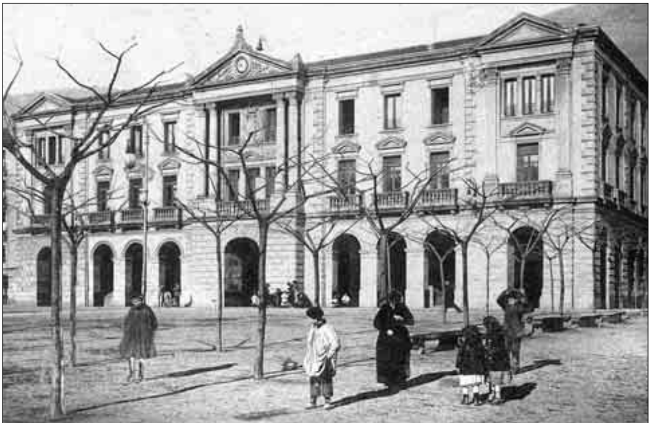
Eibarko udaletxea, XX. mendearen bilakaera sozio politikoaren lekuko isila.