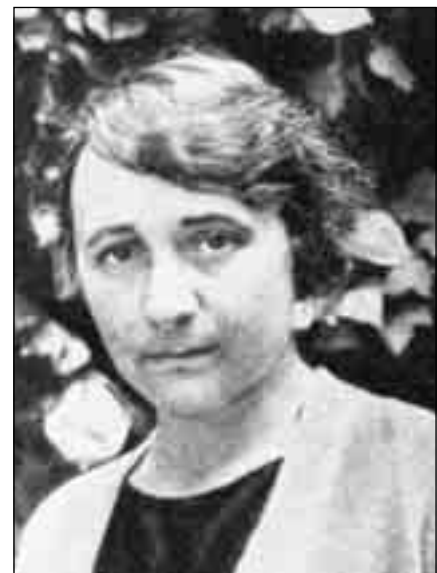
María de Maeztu, pedagoga y escritora, una de las grandes defensoras de los derechos de la mujer.

Con todo este escenario pues, Eibar, como Donostia o Irún, se alineaba en la Guipúzcoa liberal, urbana. No obstante, nuestra población vivía aquella situación de manera bastante autónoma. Por una parte, la influencia “bilbaína” era manifiesta en el aspecto del