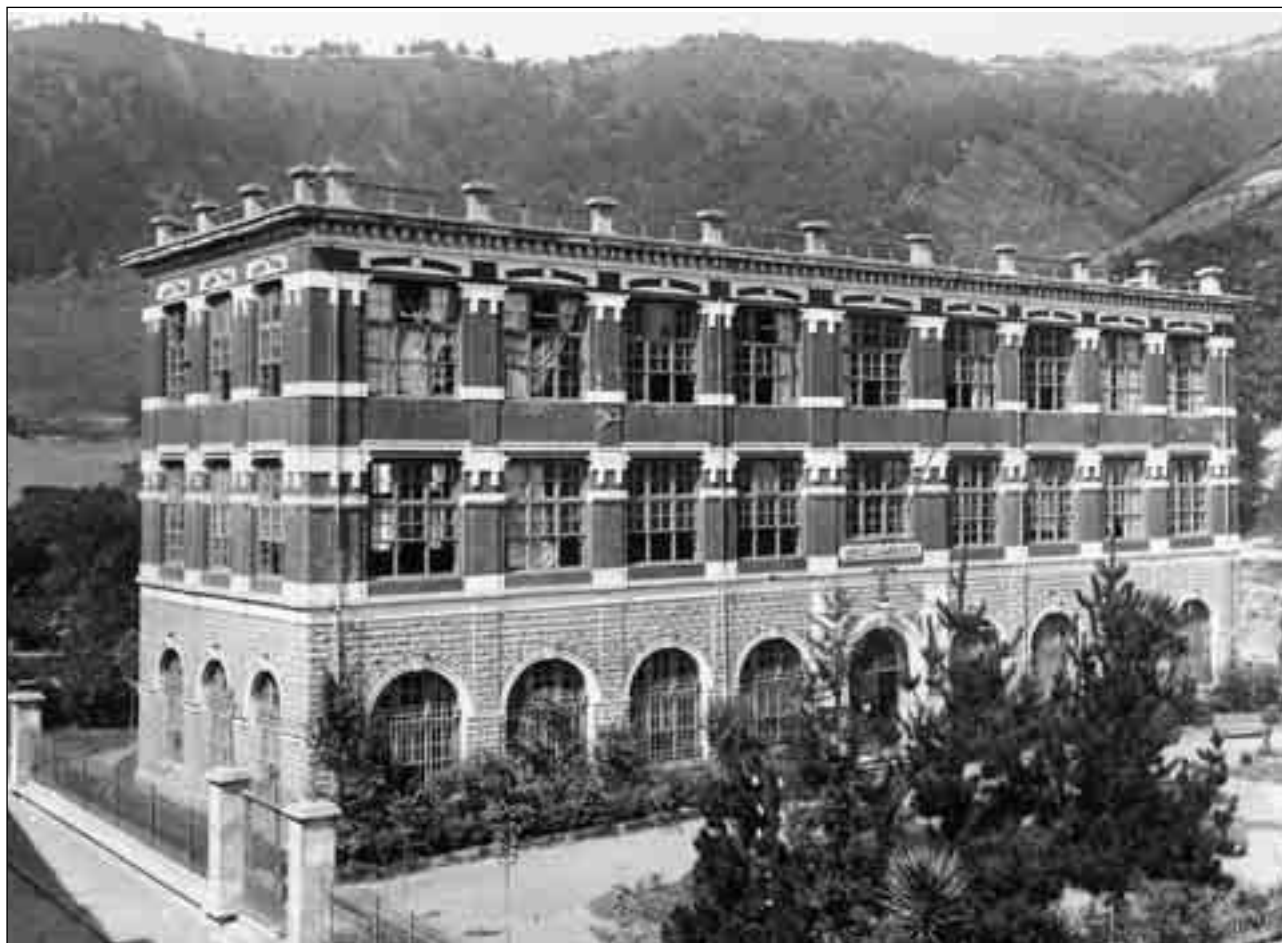
Edificio de la Escuela de Armería el día de su inauguración.

Es lamentable cruzarse de brazos y mirar con pasividad la salida del capital. ¿Qué hacer para retenerlo? Sencillamente, estudiar á fondo la creación de nuevas industrias remuneradoras, formar una ó varias sociedades anónimas para explotarlas, solicitar del estado una contrata de fabricación del material de guerra ya que ello es lógico después de la ley de protección de la industria nacional.