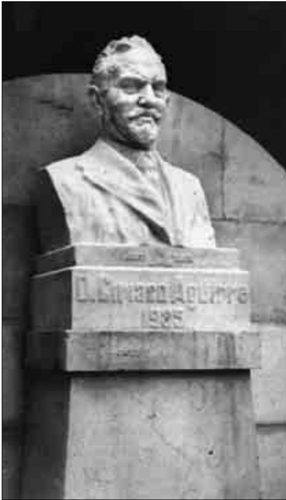
Monumento erigido en memoria del médico eibarrés Ciriaco Aguirre, uno de los fundadores de la "Liga antigermanófila" e hijo del médico liberal y euskaltzale Vicente Aguirre.

Las maquinaciones que los elementos reaccionarios de nuestra nación, aprovechando la coyuntura que la guerra les brindaba, pusieron en juego desde sus comienzos, determinaron el nacimiento en España de una Liga antigermanófila, creada con el principal designio de contrarrestar y neutralizar aquellas maquinaciones.