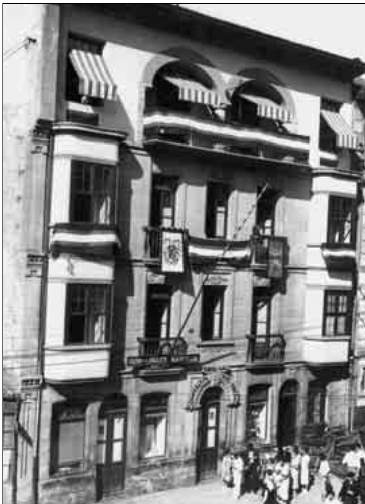
EAJ-PNVren "Bide Onera" kooperatiba. Sozialistak hasi ziren arren, ideologia gehienetara zabaldu zen kooperatibismoa.