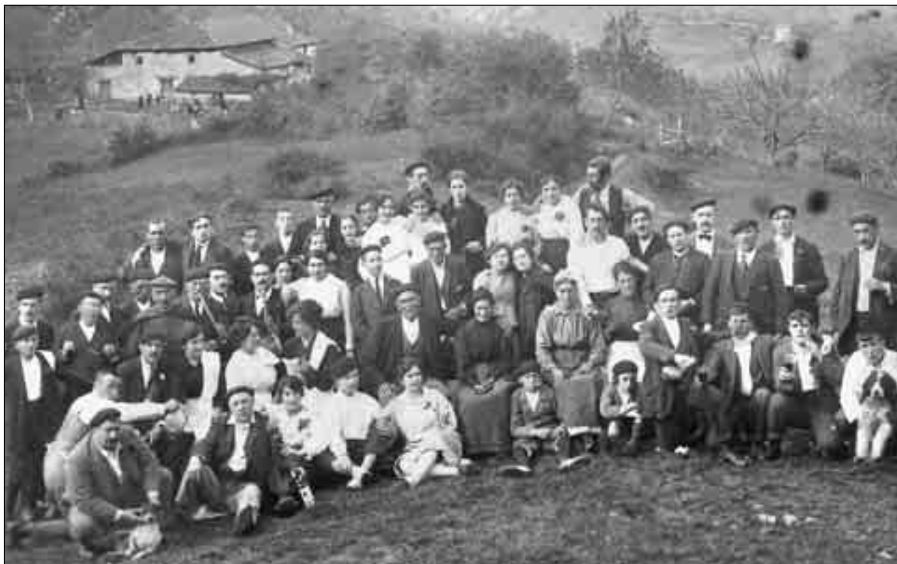
Eibartarrak erromerian.

vascuence, (...) pertenece á una banda de música, donde ingresó, no por puro temperamento artístico, sino por táctica política. La cosa es seria. Había aquí una banda cuyos músicos eran todos, ó una buena parte, conservadores. Con esta banda se solemnizaban todas las ocasiones antiliberales, lo cual ofendía al liberalismo en general. Pero ingresó en ella nuestro concejal y pronto liberalizó á todos sus compañeros. Por consiguiente, en Eibar se ha hecho liberal hasta la música 95 .