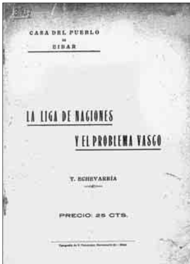
“La liga de naciones y el problema vasco” de Toribio Echebarría, libro editado en el año 1918. Toribio Echebarria Fondo. Eibarko Udal Artxiboa.

Lamenta Echebarría que las opiniones que vertía el nacionalista Ramón Belausteguigoitia en su folleto “Bases de un Gobierno Nacional Vasco”, abogando por una Euzkadi libre pero que mantuviera las libertades individuales, no fuera suscrito por la dirección del Partido Nacionalista Vasco “porque los derechos del individuo son más sagrados que los de la colectividad”.