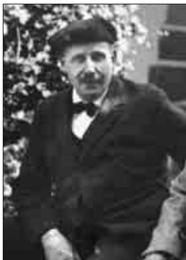
Inazio Zuloaga pintorea bere herriarekin konprometitua beti.