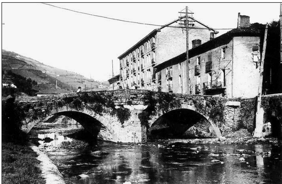
El río Ego a su paso por Urkizu, antes de su cubrimiento. Los ferrones del "Val de Ego", junto con los de Lástur y Mendaro, obtuvieron un fuero propio en 1335, once años antes de la fundación de Villanueva de Eibar.

Si las ferrerías de Arrasate muestran esta vitalidad, es casi obligado sospechar que para estos años de mediados del siglo XIII y corriente abajo del río Deba, allí donde era más fácil la represa de las aguas, en sus tramos más encajonados, como el de Mendaro, o en esos afluentes que corren por estrechos valles, como los de Lástur y Ego, funcionarían también aquellos primeros ingenios que aprovechaban la energía hidráulica para fabricar el hierro y que dejarían pronto obsoletas a las primitivas "aize-olak" ubicadas en los montes 26 .