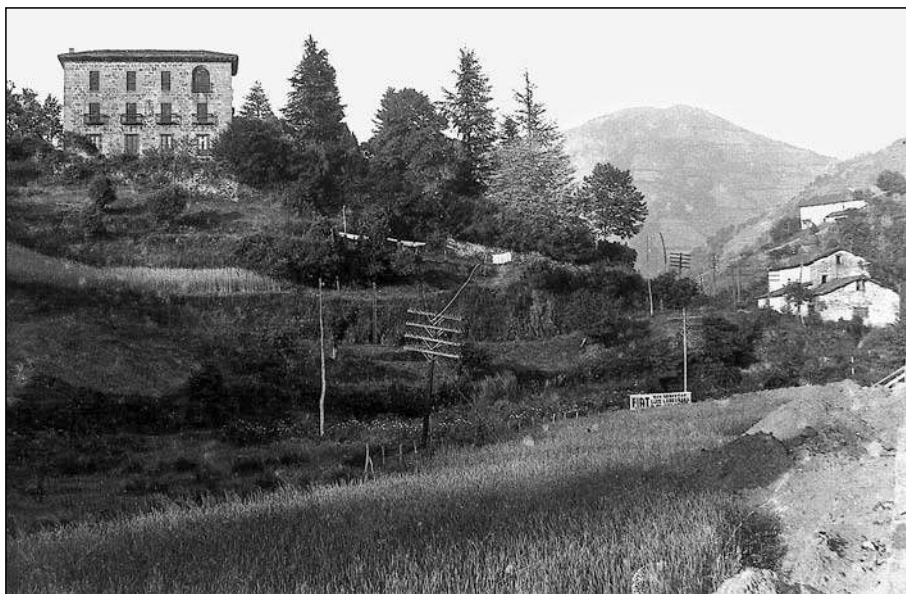
La casa solar del linaje de los Unzueta en la loma que domina el discurrir del Ego y el barrio de Azitain

Así nos lo testimonia esa casa solar de los Unzueta ubicada en una loma que domina el discurrir del Ego y que entonces también divisaría el emergente crecimiento de las herrerías y el transporte que generaban, en doble dirección, el del mineral desde Somorrostro y la salida de su producción hacia “la canal de Deba”. Levantaron allí todo su complejo señorial centrado en su “palacio” 48 y con su propia iglesia, aquel primitivo templo que precedió al que actualmente existe en el barrio de Azitain y donde se encontraba, empotrado en la pared del coro, un crucifijo románico, hoy desaparecido 49 .