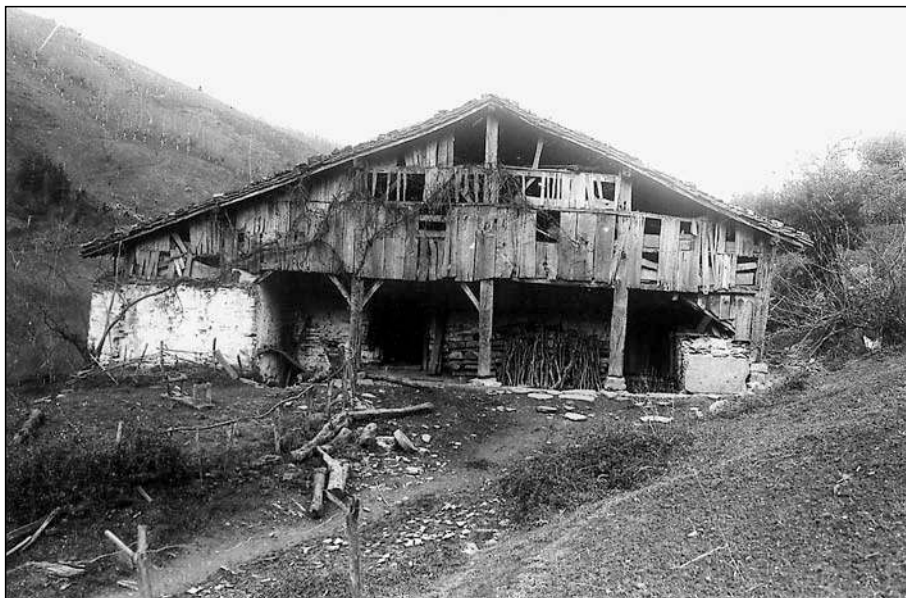
Caserío Orbe en el valle de Aginaga

valle fluvial, allí donde podían compaginarse mejor las tareas del campo con las del ganado. Presumiblemente a partir de ellas se crearon otros enclaves al fondo de la ladera, al borde de aquellos ríos que no habían sido antes más que el límite donde se cortaba el pasto y que, en cambio, a la altura del siglo XIII, o quizás algo antes, se presentaban como interesantes zonas para armonizar la dedicación a las labores agrícolas y ganaderas con la de aquellos otros sectores económicos innovadores, como el hierro y el intercambio, que requerían de forma inevitable del mismo curso fluvial, tanto para obtener la nueva energía hidráulica como para transportar el mineral y sus excedentes en "alas", pequeñas embarcaciones de quilla plana y dirigidas por una especie de pértiga que recorrerán durante siglos largos tramos de nuestros ríos.