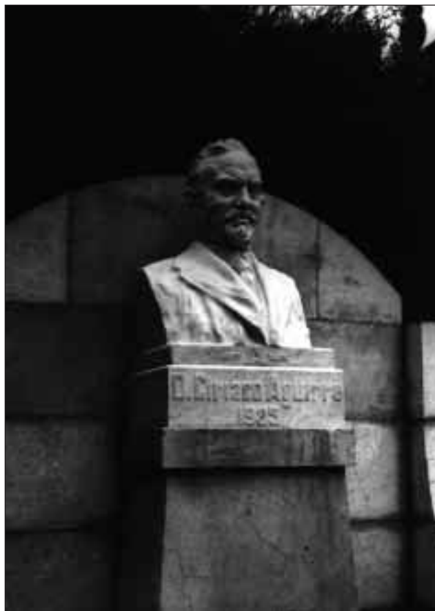
On Ziriako Agirrereren ohorez eraikitako oroitarria.