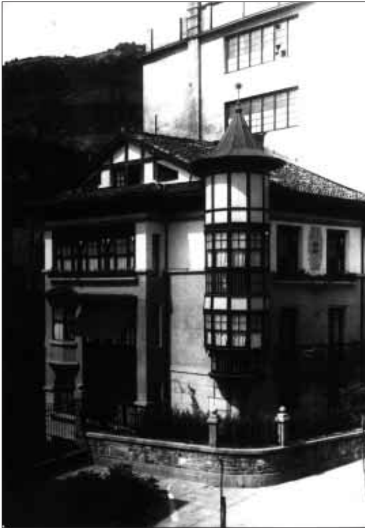
Medikokua. Agirretaren bizilekua Plaza Barrixan.