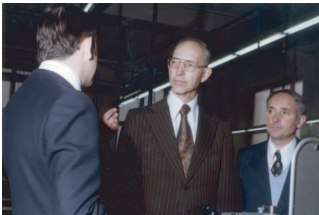
Walter West. 1977. Estatu Batuetako Kotsula Bilbon. Cónsul de Estados Unidos en Bilbao.