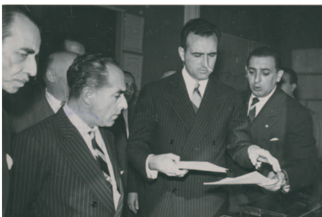
Joaquín Ruiz-Giménez. 1955. Hezkuntza Nazionaleko Ministroa. Ministro de Educación Nacional.