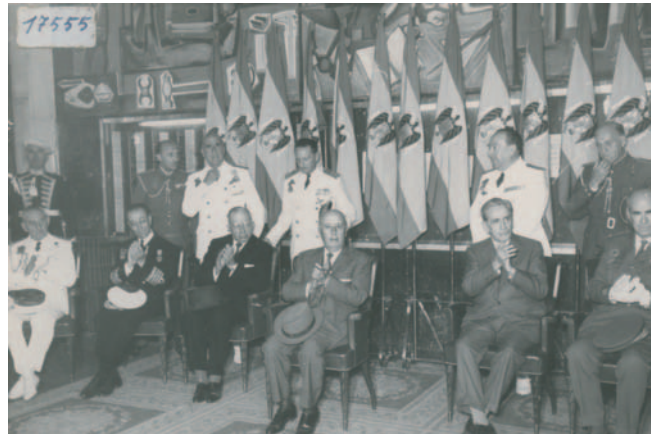
Francisco Franco. 1965. Espainiako Estaturua. Jefe del Estado Español.