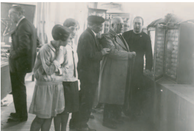
Galo Ponte. 1927. Grazia eta Justizia Ministroa. Ministro de Gracia y Justicia.