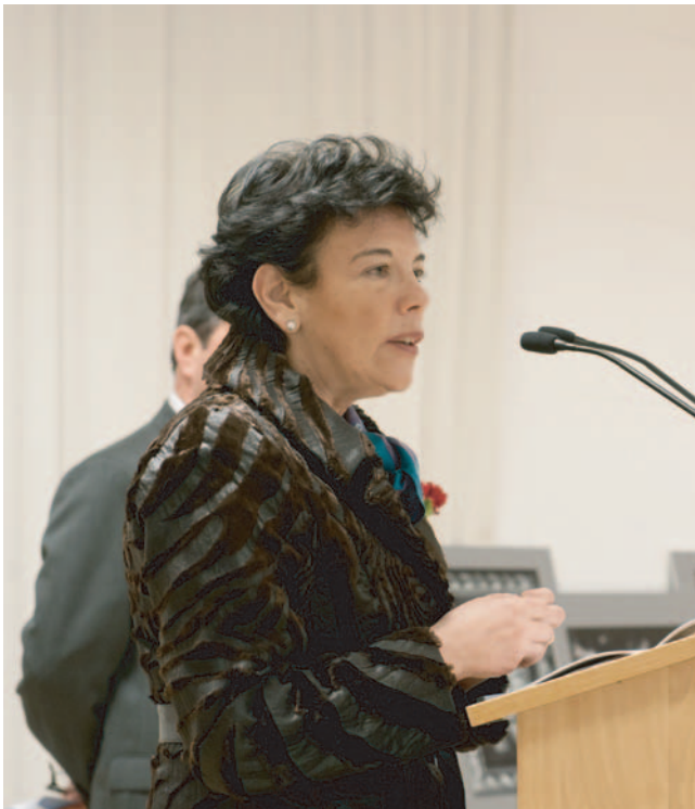
Isabel Celaa. 2012. Hezkuntza, Unibertsitate eta Ikerketa sailburua. Consejera de Educación, Universidades e Investigación.