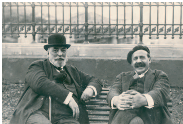
Ignacio Zuloaga. 1914. Margolaria. Pintor.