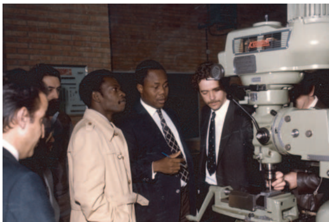
1981 Nigeriako Hezkuntza Ministroa. Ministro de Educación de Nigeria