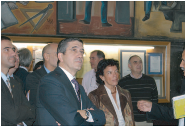
Patxi López. 2008. PSE-ko Idazkari Nagusia. Secretario General del PSE.