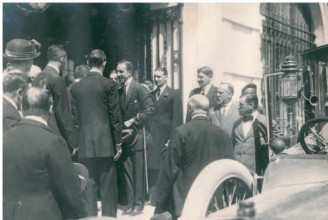
Rey Alfonso XIII. 1914. Artea eta Industrien Erakusketara bisita. Visita a la Exposición de Artes e Industria.