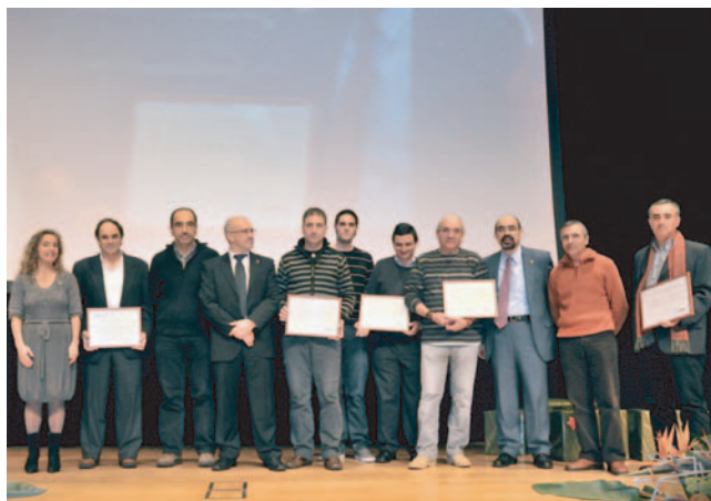
13-11-2008. Proyecto EPEA organizado por EUSKALIT sobre buenas prácticas en innovación. Alumnos y profesores premiados con autoridades.

El proyecto 'Epea', presentado por profesores y alumnos de Armeria Eskola, fue distinguido en noviembre de 2008 con uno de los Premios a las Buenas Prácticas en aulas y talleres de Formación Profesional organizado por el Gobierno Vasco. Este certamen seleccionó los mejores trabajos presentados por profesores para potenciar entre el alumnado actitudes y valores ligados al buen hacer y a la mejora continua.