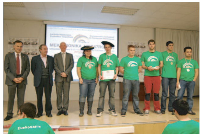
15-01-2011. Ganadores del concurso de EUSKOSKILLS con autoridades.