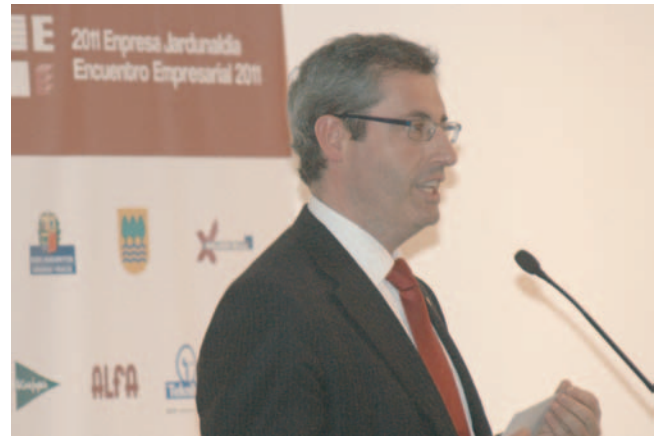
Markel Olano. 2011. Gipuzkoa Diputatu Nagusia. Diputado General de Gipuzkoa.