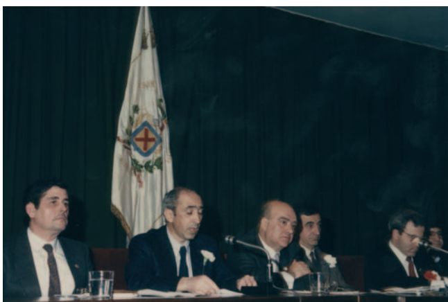
Imanol Murua. 1987. Gipuzkoako Diputatu Nagusia. Diputado General de Gipuzkoa.