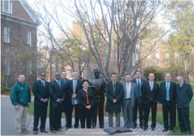
22-05-2009. Visita del Alcalde de Eibar y el Director de la Escuela junto con empresarios en Canadá.

2009. urte hasieran arkitektura-oztopoak ezabatzeko lanak hasi ziren ikastetxean; bi igogailu eta larrialdietarako eskailerak jarri ziren. Gainera, urtearen amaieran, Eskolako sarrera nagusiko hall-ean zeuden muralak berriztatzen hasi ziren.