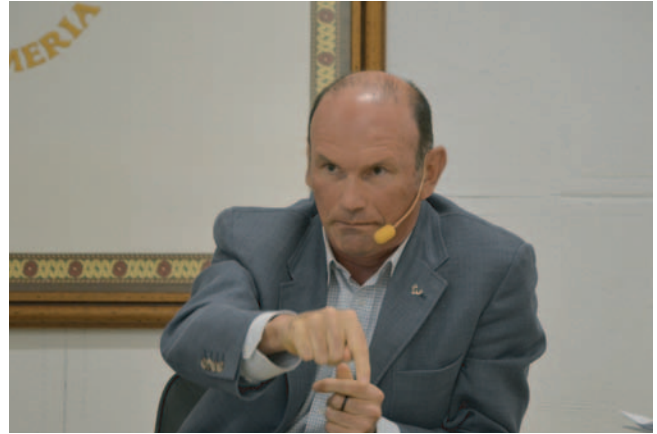
Juan José Ibarretxe. 2012. Lehendakari ohia. Ex –Lehendakari.

José Ortega y Gasset. 1927. Filosofoa eta saiogilea. Filósofo y ensayista.