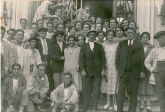
Cástor Jaureguibeitia. 1926. 'Cocherito de Bilbao'. Toreatzailea. Torero.