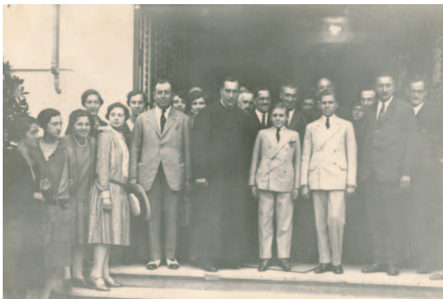
Juan eta Gonzalo de Borbón Infanteak. 1927. Infantes Juan y Gonzalo de Borbón.