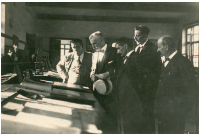
Amalio Gimeno y Cabañas. 1920. Gimeno Kondea. Conde de Gimeno. Sustapen Ministroa. Ministro de Fomento.