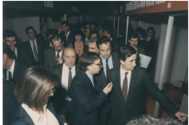
Ramón Jáuregui. 1989. Eusko Jaurlaritzako Lehendakariordea. Vicelehendakari del Gobierno Vasco.