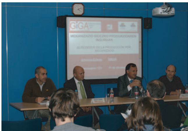
11-12-2008. Proyecto GIGA sobre la producción por mecanizado, con representantes de Tekniker, DKG Ibérica, Armeria Eskola y CMZ Machinery Group.

Ikasleen jatorriari dagokionez, %45 Eibarkoa zen, %25 Ermuakoa, %9 Soraluzekoa eta gainontzeko %22 inguruko beste 22 herritatik zetorren.