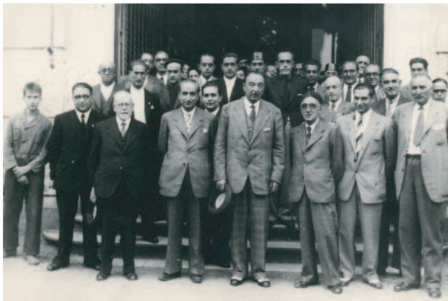
José Félix de Lequerica. 1944. Atzerri Arazoetako Ministroa. Ministro de Asuntos Exteriores.