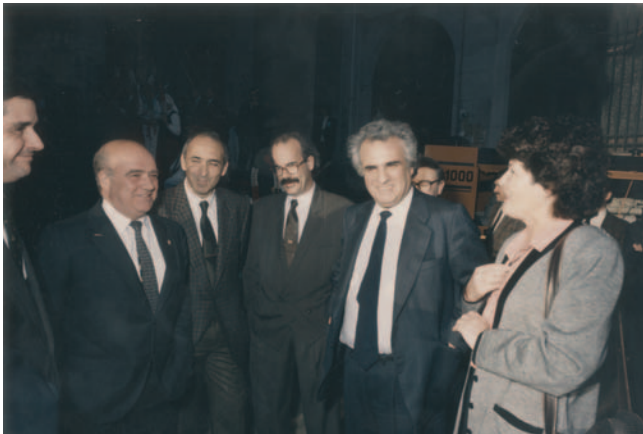
Enrique Múgica. 1989. Justizia Ministroa. Ministro de Justicia.