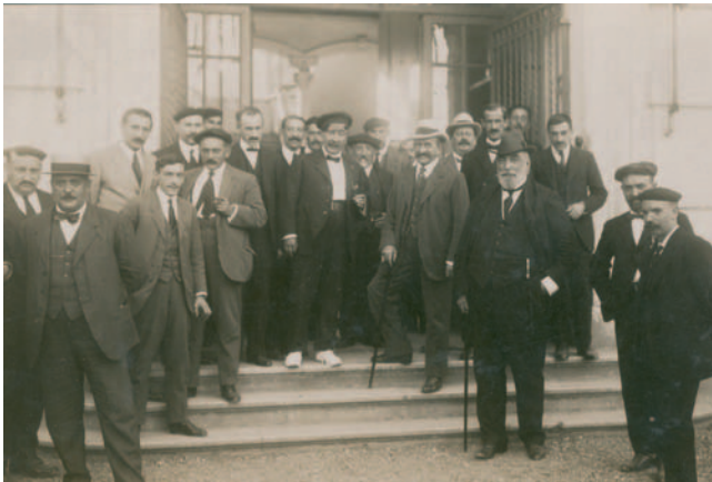
Álvaro de Figueroa y Torres. 1927. Romanones-eko kondea. Conde de Romanones.