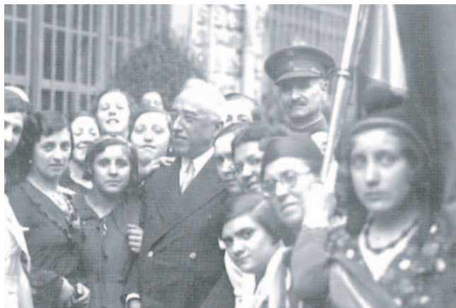
Niceto Alcalá Zamora. 1932. Errepublikako Presidentea. Presidente de la República.