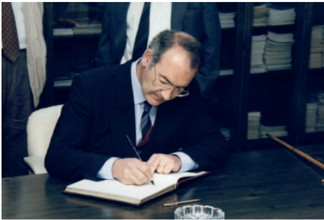
José Antonio Ardanza. 1987. Lehendakaria.