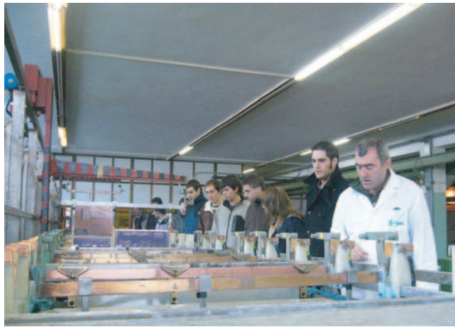
11-11-2007. Visita de los alumnos de DPE (electrónica) a la empresa KELAN.

2008-2009 ikasturte hasieran, Eskolako prestakuntza-zikloetako matrikuletan %20ra arteko hazkunde egon zen. Azpimarratzekoa ere bada matrikulatu ziren ikasleen laurden bat D hizkuntza-ereduan (euskara hutsean) matrikulatu zela, eta horrek erakusten zuen ikastetxean ematen ziren irakaskuntzetan euskara finkatuz zihoala.