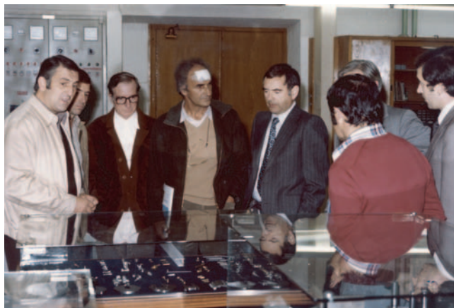
Eduardo Chillida. 1978. Artista.