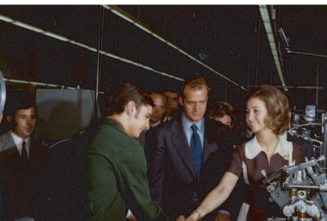
Juan Carlos y Sofía. 1973. Espainiako Printzeak. Príncipes de España.