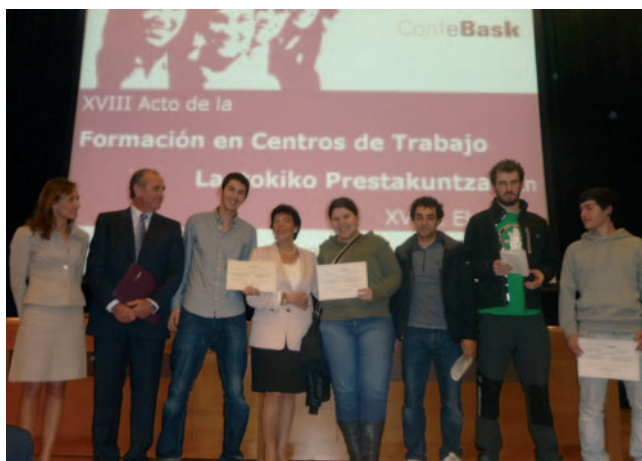
16-11-2011. Acto de entrega de diplomas y premios en el Euskalduna de Bilbao, organizado por CONFEBASK. Alumnos de Armeria Eskola recibiendo el diploma de la realización de las FCT (formación en centros de trabajo).

Para la Escuela, se lograba que sus alumnos