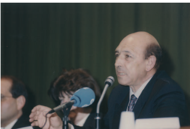
Eli Galdos. 1993. Gipuzkoa Diputatu Nagusia. Diputado General de Gipuzkoa.