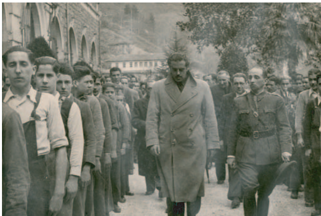
José Antonio Girón de Velasco. 1942. Lan Ministroa. Ministro de Trabajo.