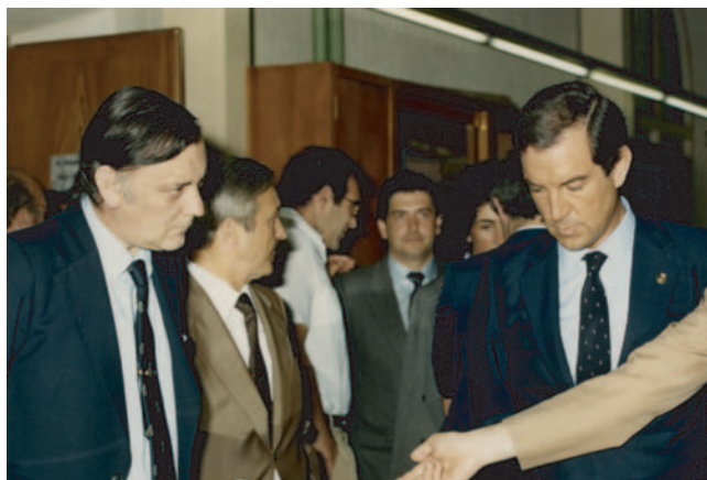
Carlos Garaikoetxea. 1982. Lehendakaria.