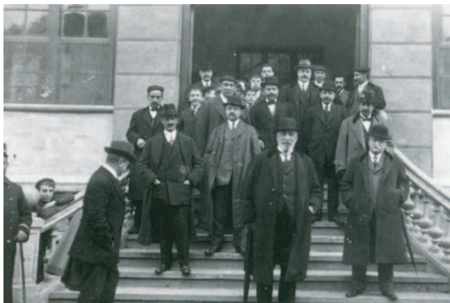
Fermin Calbetón. 1914. Sustapen Ministroa. Ministro de Fomento.