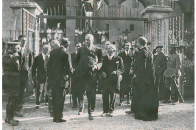
Miguel Primo de Rivera. 1927. Ministro-kontseiluko Presidentea. Presidente del Consejo de Ministros.