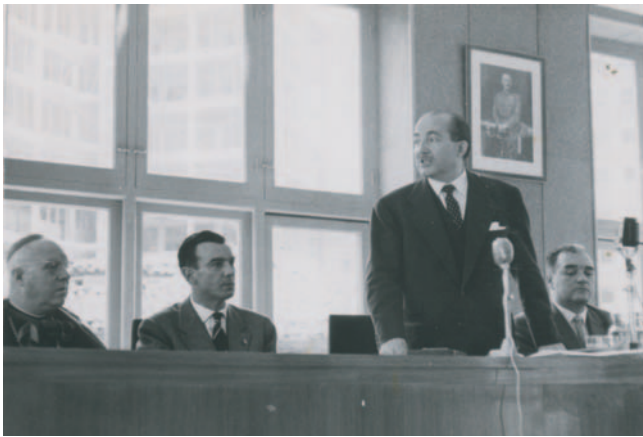
Jesús Rubio García-Mina. 1960. Hezkuntza Nazionaleko Ministroa. Ministro de Educación Nacional.