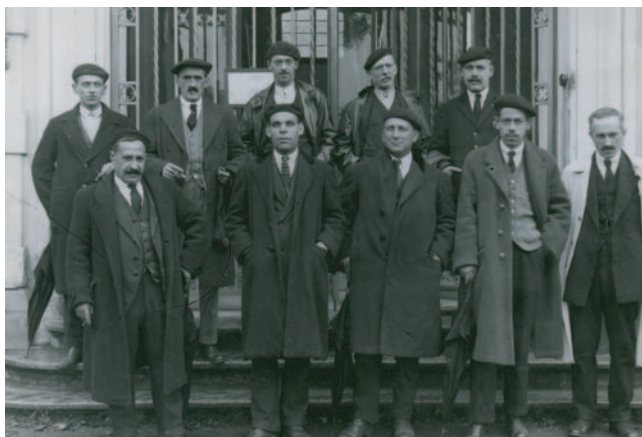
Francisco Largo Caballero. 1923. Politikari sozialista. Político socialista.