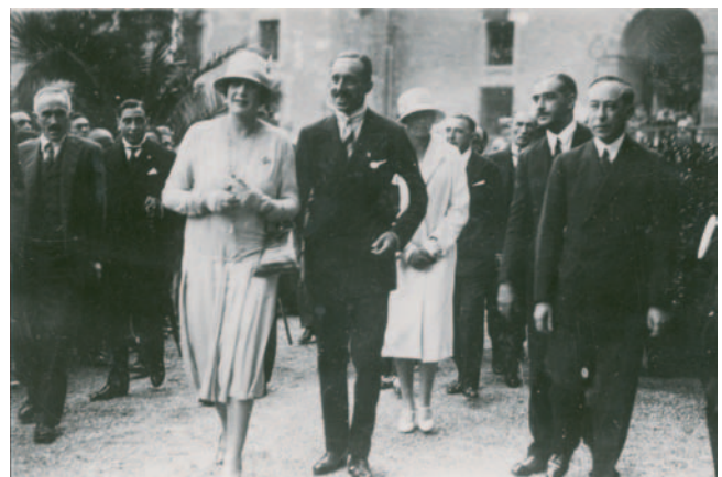
Alfonso XIII Erregea , haren emazte Victoria Eugenia Erregina eta haien alaba, Beatriz Infanta . Rey Alfonso XIII , su esposa la Reina Victoria Eugenia y su hija la Infanta Beatriz . 1927.