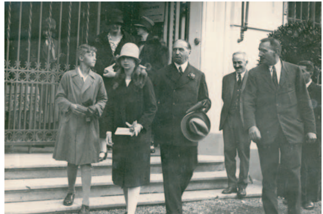
Otto printzea eta haren arreba, Zita de Borbón-Parma , Zita Enperatrizaren seme-alabak. Príncipe Otto y su hermana , hijos de Zita de Borbón-Parma, Emperatriz Zita. 1927.