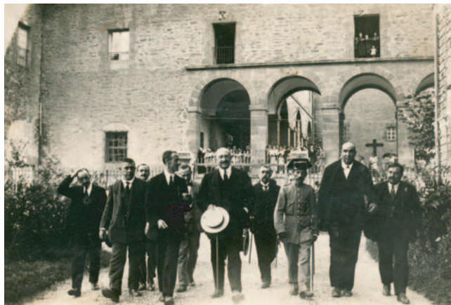
Indalecio Prieto. 1919. Politikari sozialista. Político socialista.