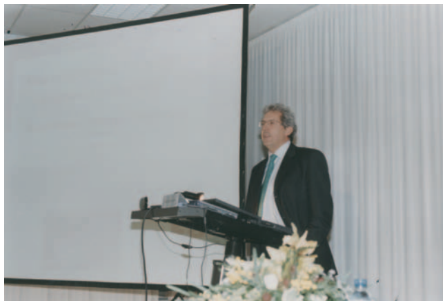
Pedro Miguel Etxenike. 2001. Zientifiko ikerlaria. Científico investigador.