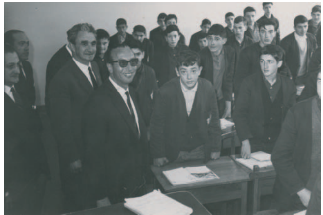
Jesús Romeo Gorría. 1963. Lan Ministroa. Ministro de Trabajo.