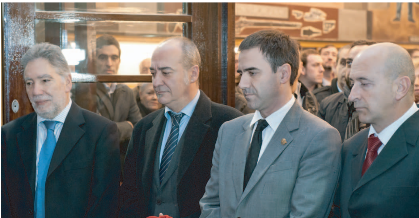
Carlos Crespo. 2012. LH eta Hezkuntza Iraunkorreko sailburuordea. Viceconsejero de FP y Formación Permanente.