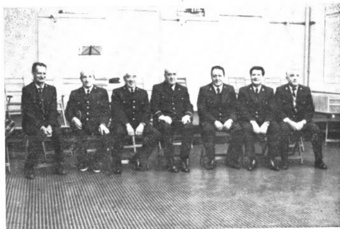
Beneméritos músicos de nuestra Banda recientemente homenajeados.

Esta crítica también les ha movido a los obispos vascos a hablar de las implicaciones que la economía tiene en lo religioso y moral.