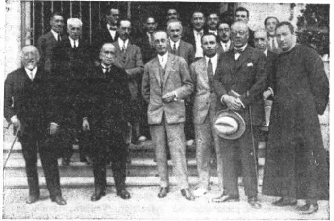
Personalidades en la Escuela de Armería.