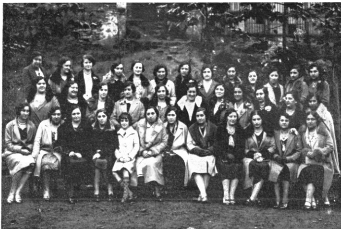
Año 1930. Mujeres eibarresas

Kristo eta gu bat egiñik gaude Bataio egunetik. Eta nola Kristo berpiztua izan dan, esan genezake gu ere berpiztuta gelditu gerala. Ortarako auxe bakkarik eskatzen zaigu: azkatasun osoarekin murgildu gaitzela Kristo'ren bizitzan. Eta orrela, Kristo rekin, salbazio eta berpizkunde alderdian ipiñiak izan gera. Au bai dala gauza zoragarria!