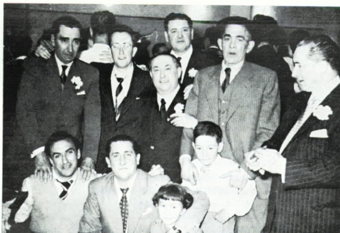
T. SARASUA'KIN BERBETAN

PROYECTO PRESUPUESTO 86 978.241.350 ptas.