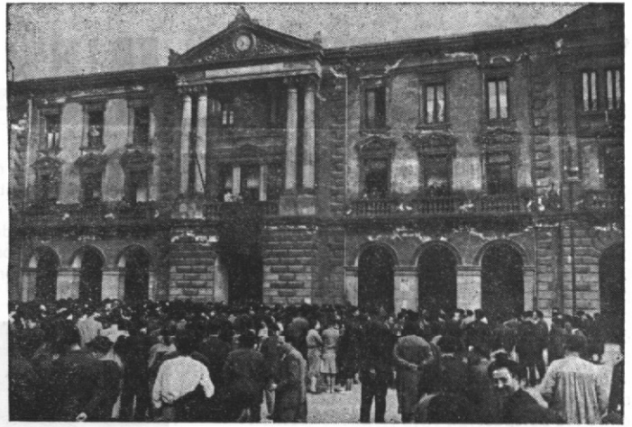
Aquí había gentes con alpargatas

Los días de lluvia, muchos hombres usaban «txankuluak», calzado todo él de madera, donde se introducía el pie enfundado en la alpargata. Su diseño, recordaba un poco la góndola veneciana. Producía un sonido muy espe-