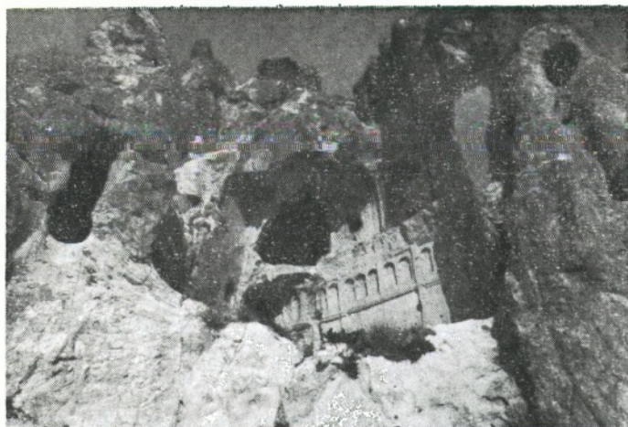
Sensacional Iglesia rupestre

En los primeros años del Cristianismo, los paganos convertidos al Evangelio buscaron un lugar seguro para practicar su fe. Las ciudades que excavaron en esta región de Capadocia constituían para ellos un verdadero remanso de paz. Más tarde, ya desde el siglo IV, las ciudades subterráneas fueron utilizadas como refugio ante las invasiones de persas y árabes. Y cuando