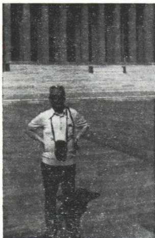
Frente al mausoleo de Ataturk

3 de Agosto. El día de ayer, tras la breve estancia en Estambul, a la que, Dios mediante, retornaremos los cuatro últimos días de nuestro viaje, pernoctamos en Ankara, la capital de Turquía a partir del 14 de Octubre de 1923. Desde entonces, dejó de ser un pueblo para ir convirtiéndose en una gran metrópoli que hoy cuenta con tres millones y medio de habitantes.