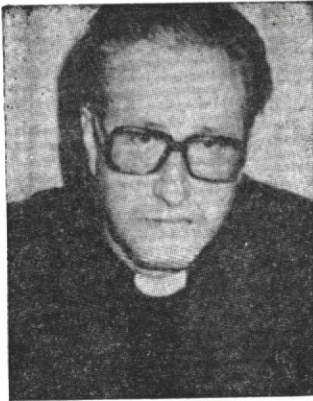
Mons. Setién, ante el comienzo del curso escolar aborda la cuestión

El obispo de San Sebastián, como comienzo del curso escolar y catequético, ha escrito una carta a sus diocesanos. En él hace referencia a la Ley Orgánica de Ordenación General del Sistema Educativo, tema de gran trascendencia social, puesto que afecta a todo el sistema escolar. Remarca el obispo donostiarra que el mencionado proyecto de ley, denominado LOGSE, no recoge las modificaciones que hubieran sido necesarias en relación a los derechos de la persona y de la sociedad, modificaciones que los obispos del Estado reunidos en Asamblea Plenaria las propusieron. Supuesto que la LOGSE es una realidad impuesta, nosotros no hemos de pen-