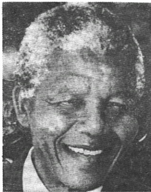
El leader Mandela

El gran cáncer en el panorama político de la población negra es Inkatha, un viejo movimiento cultural zulú convertido por su jefe Buthelezi en partido político y que dice contar con millón y medio de miembros, todos de la tribu zulú. Mientras algún otro grupo agrupa a gente joven que por su trabajo y desplazamientos están