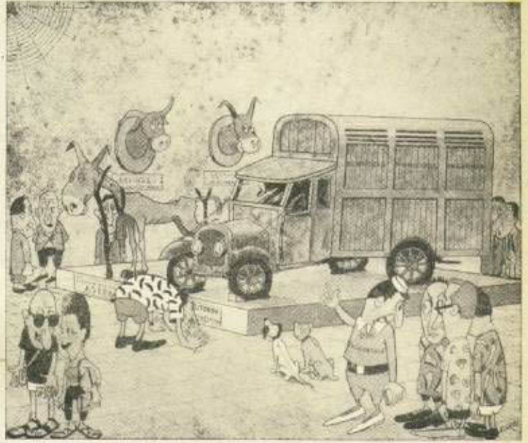
GORAINTZI (RECUERDO), por A. Marful.

—Ez ezutu —erantzun eutsan eibartarrak— atzeratuta-kuak partzen diardu.