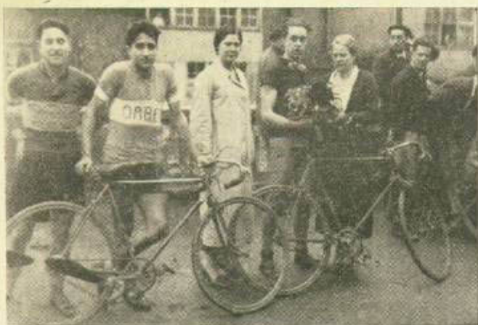
Recuerdo deportivo de hace 30 años.