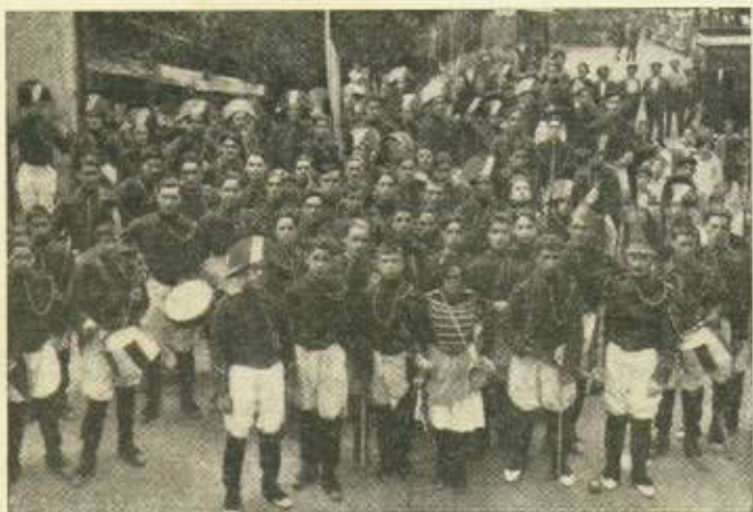
Tamborrada en 1932.