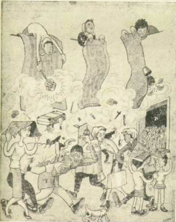
GOIZALDEKO BERINKAZIOA, por A. Marful.