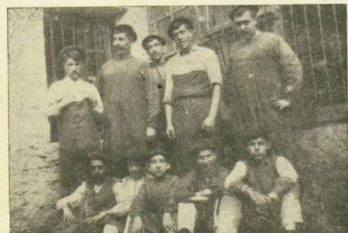
Hace medio siglo, en un taller de 2 de Mayo. (Foto Ojanguren).