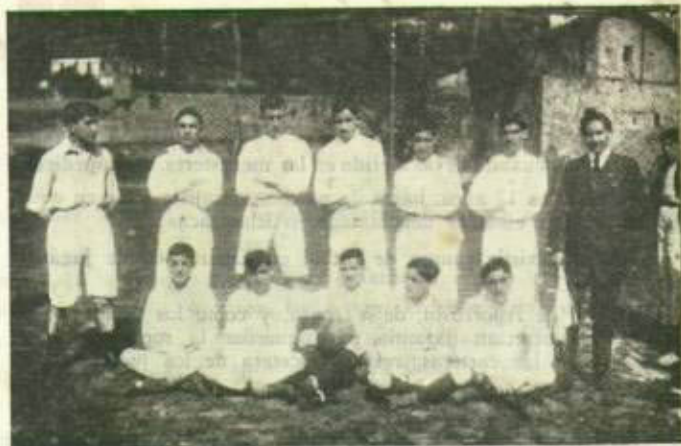
Un antiguo equipo eibarrés.

Lo que tanto anhelábamos se había por fin convertido en realidad: vencer en disputa oficial a los vergarese, y cuando nos disponíamos a enarbolar la copa para pasearla triunfalmente por las calles de Eibar cantando el alirón ocurrió un