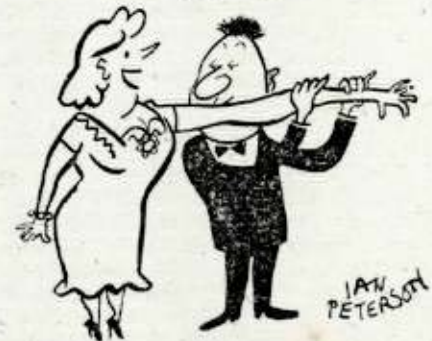
La fuerza de la costumbre.