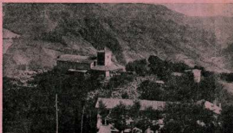
Vista de conjunto del Arrate actual. En primer término: el Hostel.

Sencillamente, ¡inexplicable! Con lo que—una vez