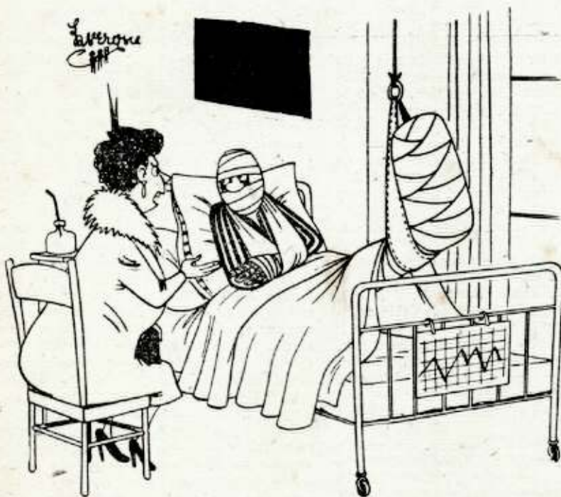
...y nada de esa mirada estúpida cuando te estoy hablando!