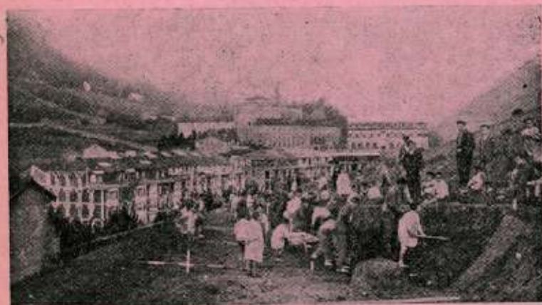
Año 1917. Empiezan las obras de la carretera de Arrate.