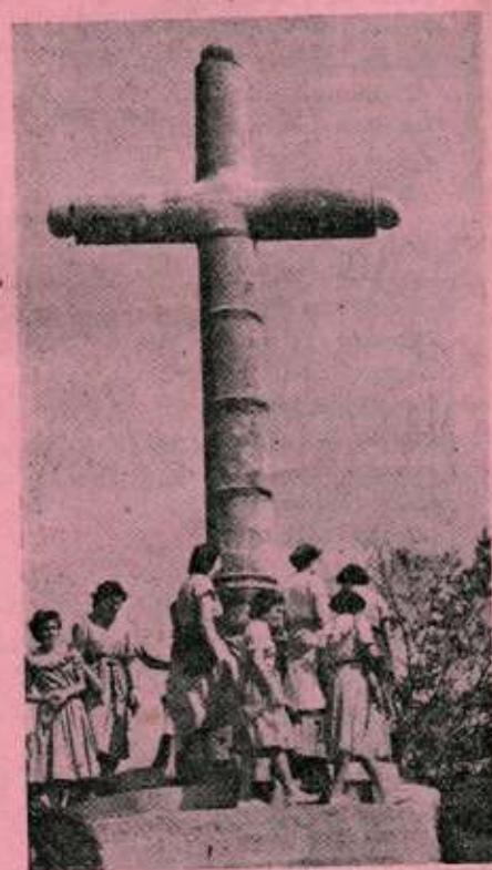
La tradicional vuelta a la Cruz de Arrate.