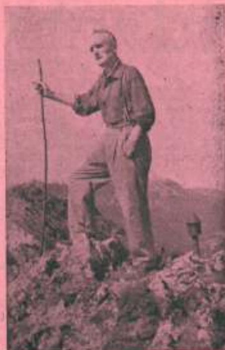
«El Fotógrafo Aguila».