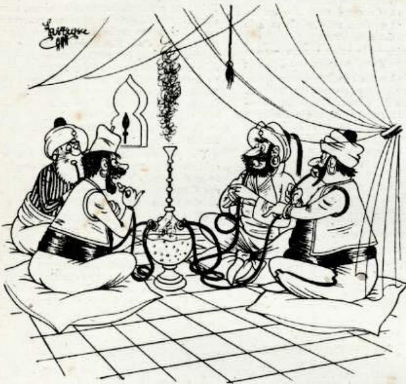
¿Quién de vosotros ha tomado ajo?