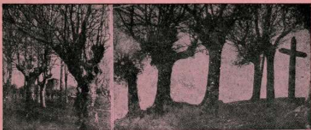
Visión poética en Arrate.