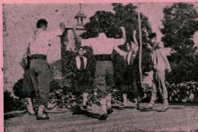
Festejos populares en Arrate.