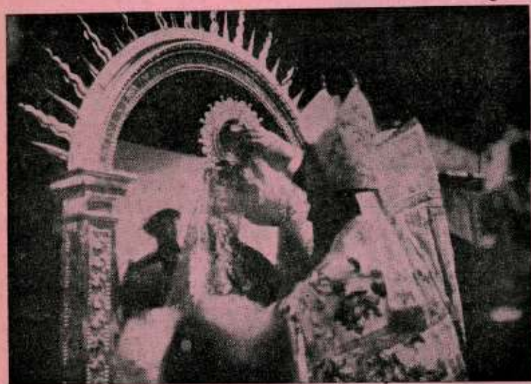
Año 1929. Mons. Múgica corona a la Virgen de Arrate.