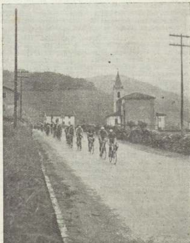
Corredores en ruta.