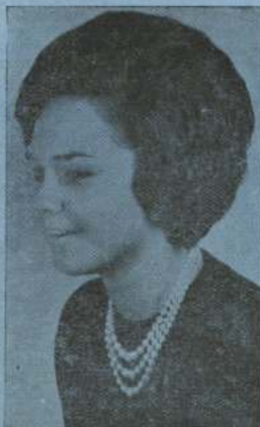
Isabel ARTAMENDI, REINA