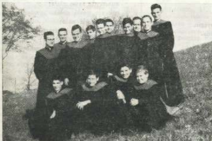
Nuestros seminaristas que estudian en San Sebastián.