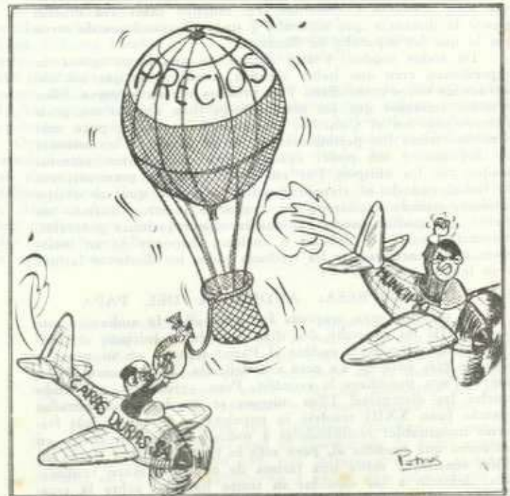
¡Eh; que eso lo he puesto yo para que baje el globo!