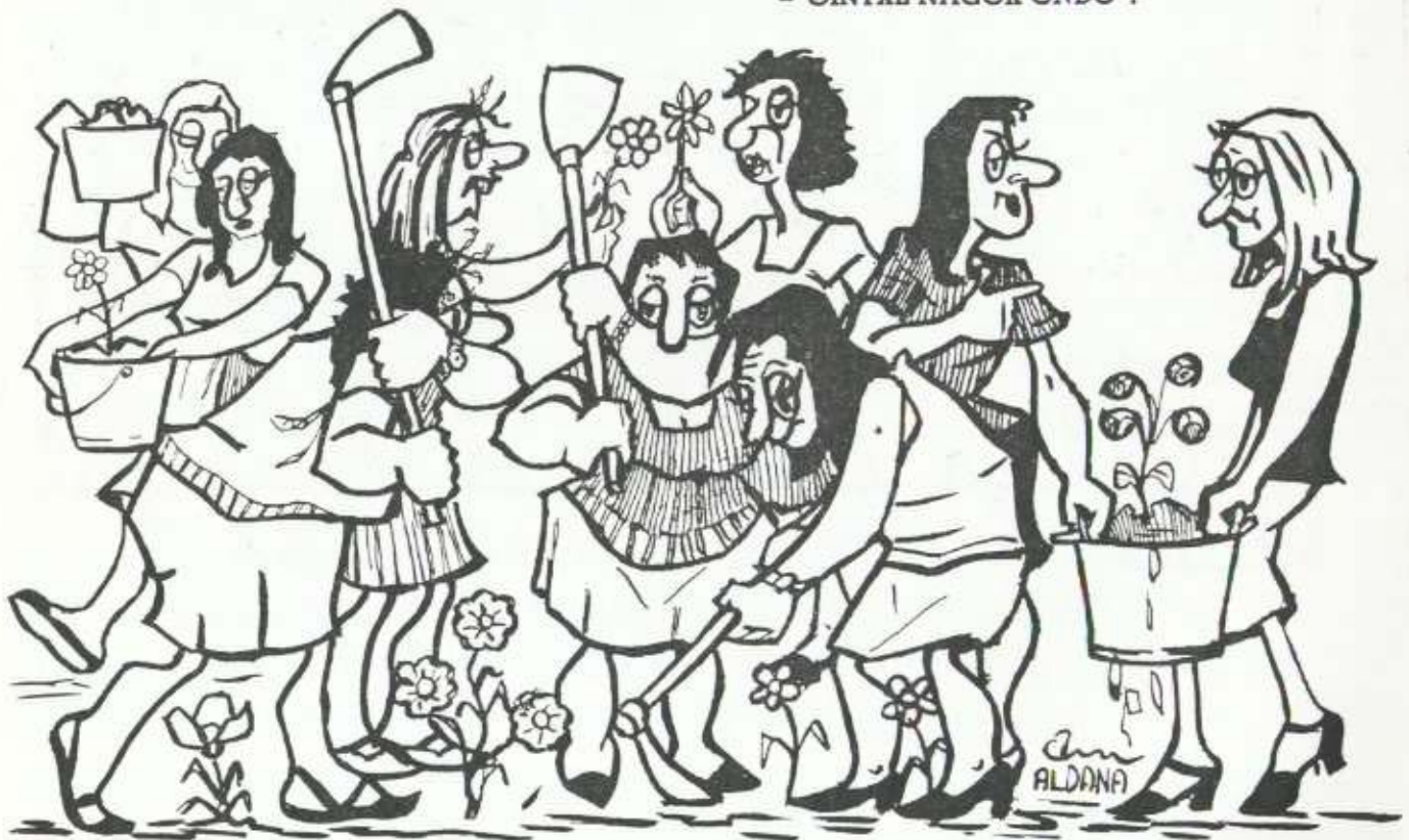
Comentario humorístico a una noticia de la calle Esteban Orbea.