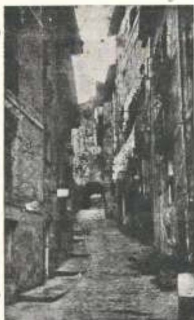
Das fotos de 1920

Todo parecía resuelto, cuando nuestra ilusión se vino al suelo. El Director del Timbre -alegando que la guía de pertenencia había sido creada en virtud de una Ley- desegó lo solicitado.