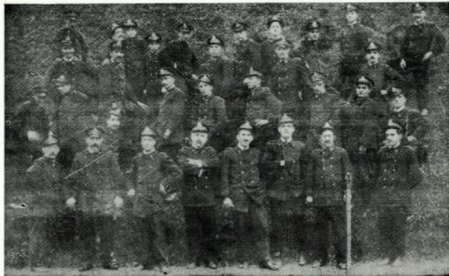
29 de Septiembre 1918. La laureada Banda Municipal de Eibar retratada en Marquina.