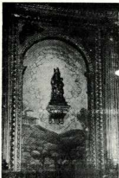
AMA BIRGIÑA AGERTZEN DA...

Arrate'ko "lelendak" diñuanez antxiña-antxiñako gizaldietan artzai bat zebillen, egunero lez, Eibar ondoko mendi gain baten ardiak saintzen