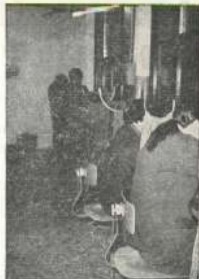
Trabajando en serio

Estábamos hablando cuando ha sonado una sirena. Es la hora de terminar la tarea. Todos, al instante, han dejado sus puestos de trabajo. Las chicas quitan el polvo. Ellos llevan al almacén las cajas de la tarea diaria. Todos se quitan su vestimenta de trabajo, se asean y con gozo profundo que no le puedan disimular en sus rostros se marchan a sus casas.