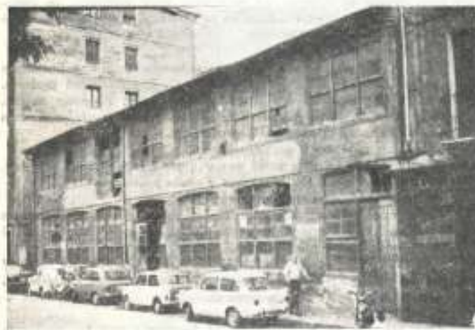
Antiguo taller de Garmuñaga, frente al parque de Urkizu.