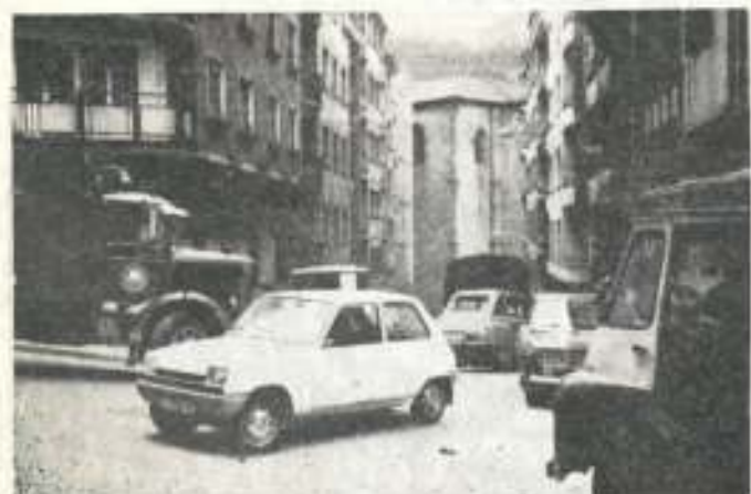
Vistalegre, embotellado de coches.