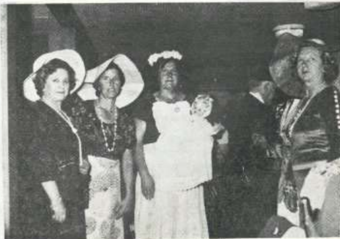
Al año siguiente, bautizo.