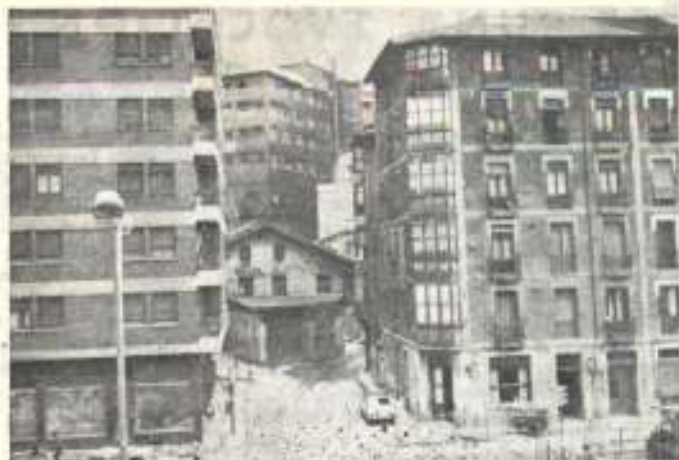
La entrada de Chonta.