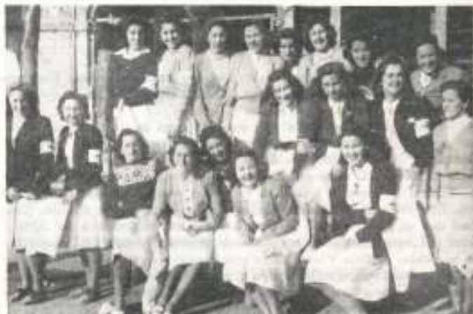
Chikito de hooe 25 años —algunas ya abuelas— postulando para la Cruz Roja.