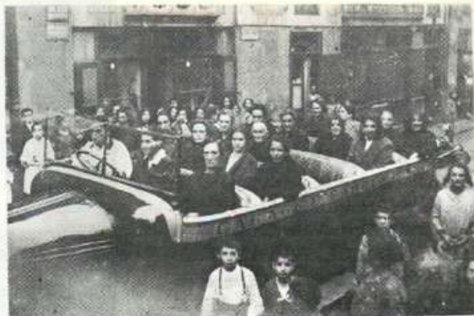
Año 1924. El "Garage Elbarrés" por Calbetón.