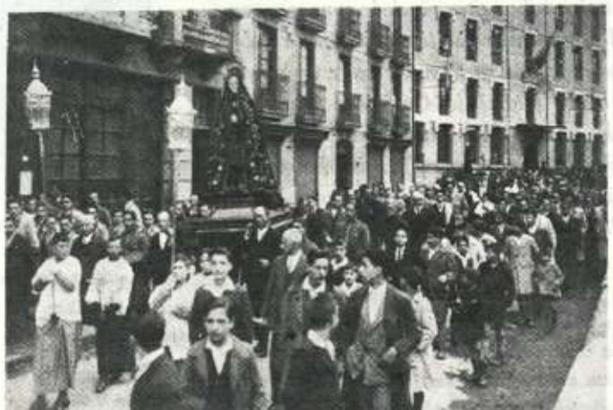
Año 1928. Procesión por Bidebarrieta.