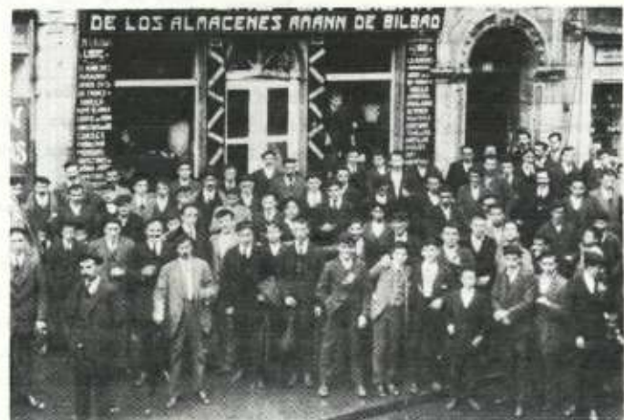
Eibarreses en María Angela, frente a la tienda Amann.