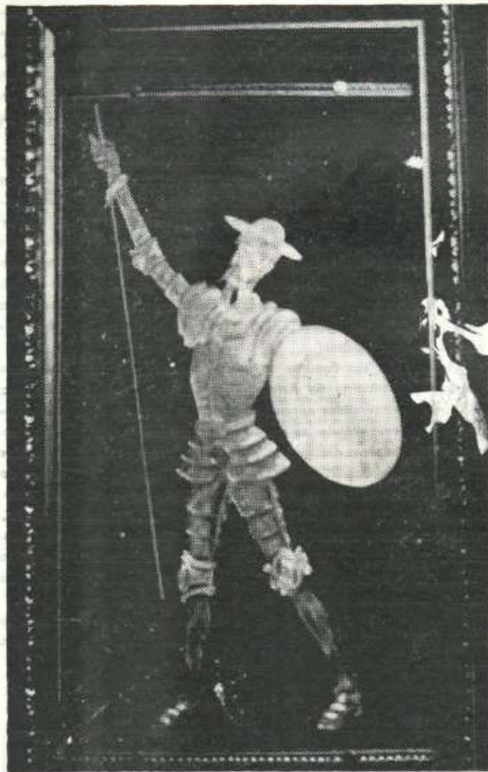
Una obra de damasquinado.