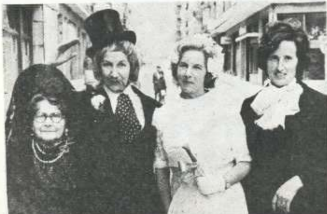
Por Santa Rita "boda" en Lequeitio.