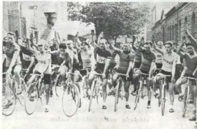
Año 1939. Un comienzo de Carrera: subida a Arnate.