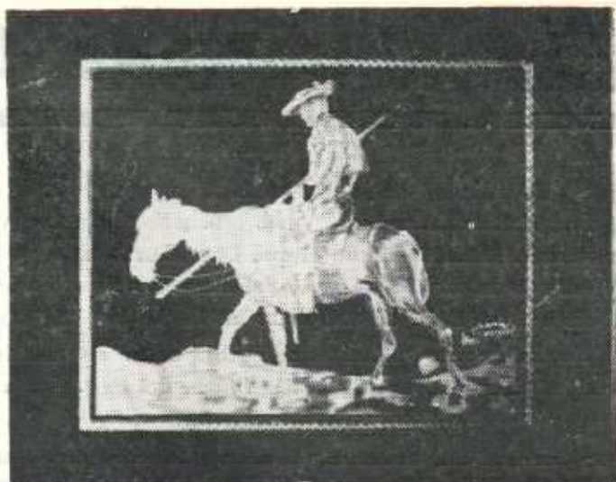
Un trabajo de damasquinado.