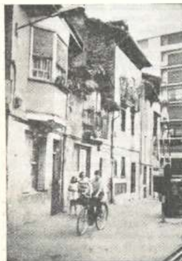
Calle Fundadores, Estación y Ardanac