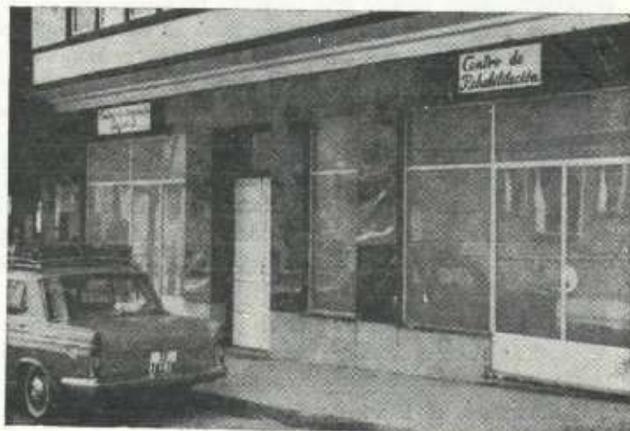
El Centro de Bidebarrieta núm. 32

—Habilitación del Antiguo Sanatorio. Este tema no puedo confirmáros mucho. Sólo os diremos que estamos intentando darle un mayor auge y aprovechamiento, para lo que queremos realizar obras de gran importancia en orden a mejorar su interior y exterior.