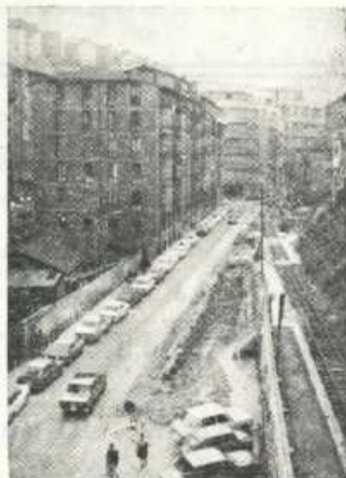
Pronto, paso subterráneo en Lejarre. Presupuesto: 3.549.413 pesetas