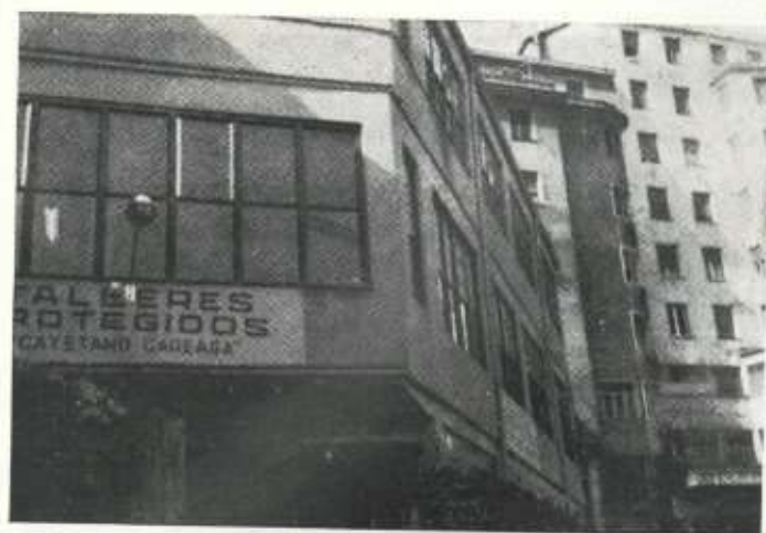
Los Talleres Protegidos "Cayetano Carrera"