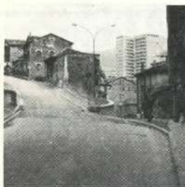
Empalme nuevo entre Legarre y la carretera de Arrate.