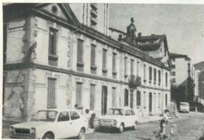
La Residencia San Andrés antes y...

¡No, no! Cuidado, los donativos al Centro son para los más necesitados. Es decir, nosotros hemos calculado cuánto cuesta al mes un anciano en la Nueva Residencia. Según este coste, el que tiene mucha "pasta" (o su familia) paga íntegramente lo que cuesta, el que tiene poco aporta muy poco, y el que no tiene nada, no da nada. Pero te aseguro que nadie sabe quién paga y quien no paga, y desde luego lo que nosotros damos sirve para mantener a aquellos que tienen poco o nada.