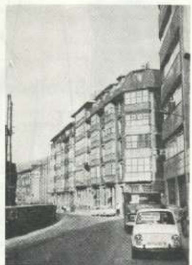
San Andrés kalia