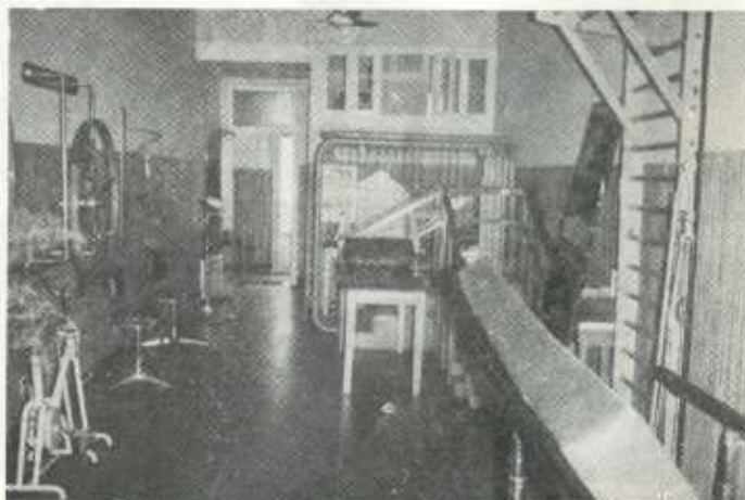
Interior del Centro de Zuloagás núm. 7