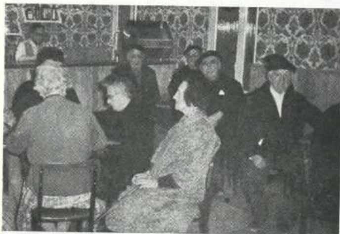
Una preocupación del Patronato: los ancianos

Todas estas obras asistenciales son de tal envergadura que vamos a analizarlas una a una por orden cronológico a la par que vemos el desarrollo histórico del Patronato eibarrés de Beneficencia Infantil y Obras Sociales. Lo que haremos a partir de este momento y en todos los números del suplemento de la Revista Eibar que edita este Patronato.