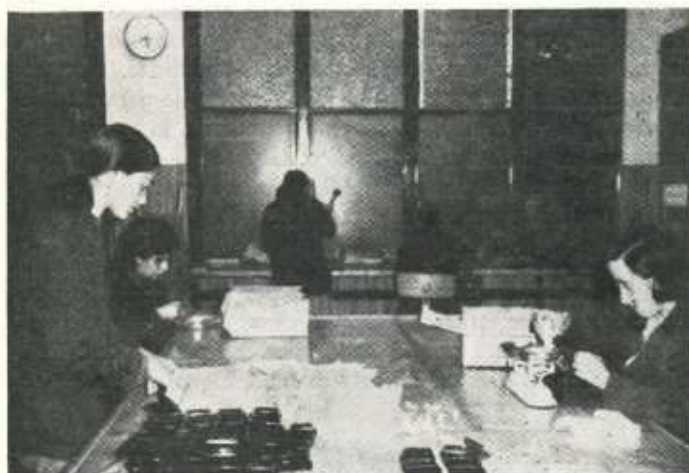
En los "Talleres Protegidos Cayetano Careaga"