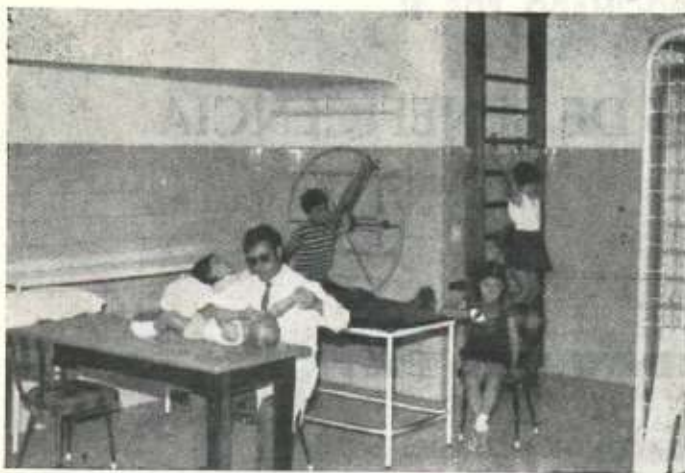
Haciendo ejercicios de rehabilitación