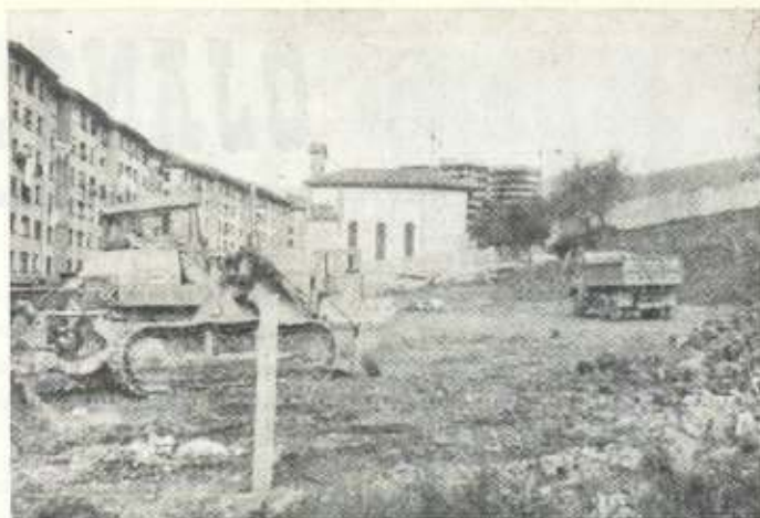
El Polideportivo ya empieza a nacer