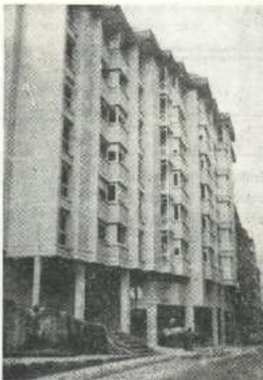
Aquí estuvo la forja de Errasti y la fuente de Urquiza