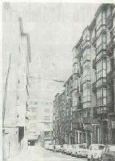
Kale barrí eda Grabadorea.

Los años de la República de 1931 para cuya proclamación Eibar tanto madrugó, tampoco resolvieron, ni mucho menos, nuestros problemas industriales. La economía del Eibar industrial, en muchos casos estigmatizada de números rojos en los Bancos, seguía en gran parte una vida lánguida.