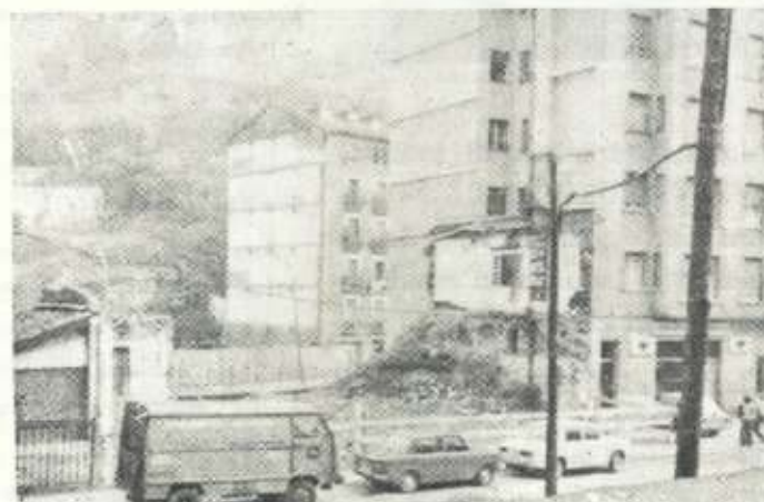
Desapareció la Panadería Urkizu