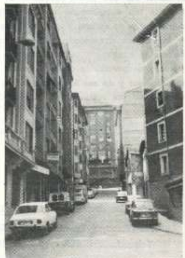
Calles Txirio, Ibarrecrus y Paguey