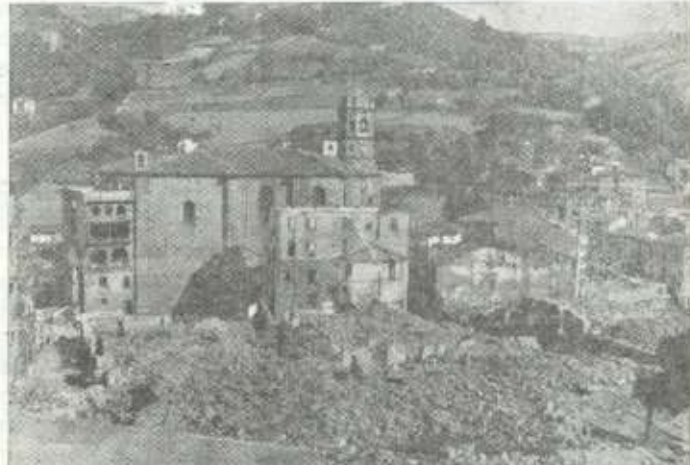
Año 1957 - Alrededores de la Parroquia San Andrés en ruinas.