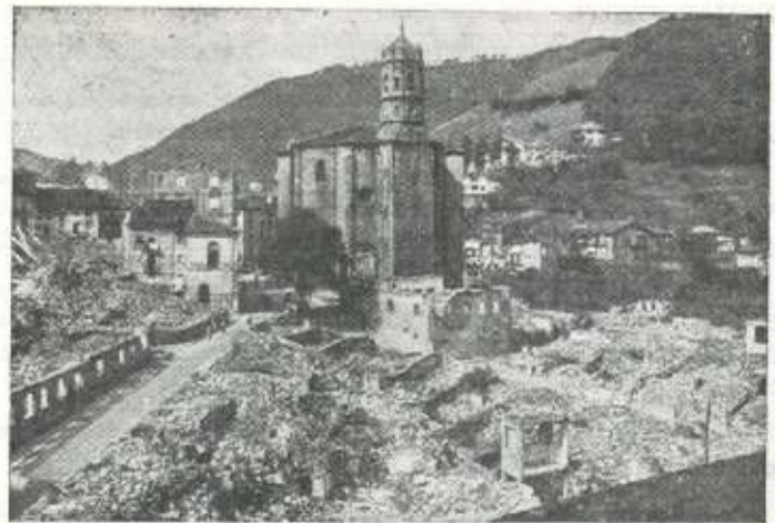
Eibar en 1937