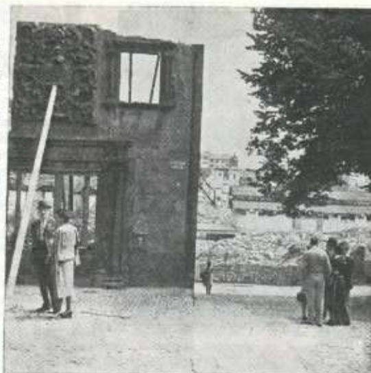
Barrenkale y Casa Mallea