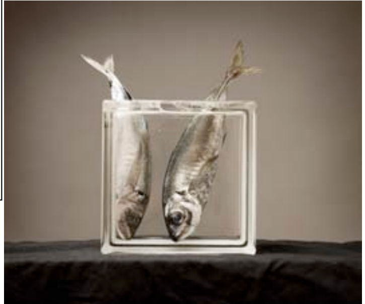
Egilea / Autor: Javier Fernández Ferreras

Hasiera batean, argazki onenak aukeratzen ziren ARGIZAIOLA sarirako. Orain, oster, argazkilari sarituak gonbidatzen dira, eta beraiek aukeratzen dituzte aurkeztuko dituzten argazkiak