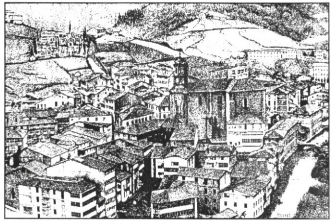
— EIBAR ZAHARRA — Julen'ek eginda 1982

Aren aurretikua bera bidiak ari gertatzen, ur bizixan garbiturik ziranak ben'tan garbatzen.