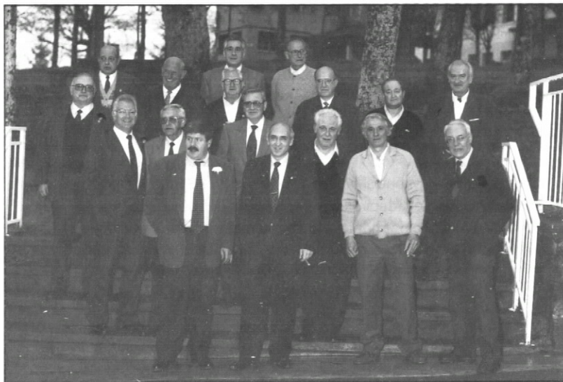
1994. 50 aniversario