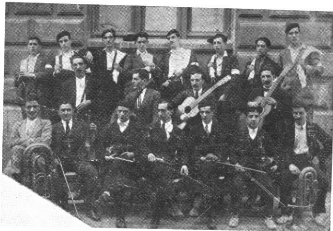
Componentes de la Orquesta Bretón.