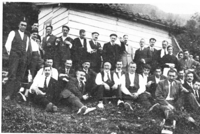
Año 1920. Eibarreses de excursión.