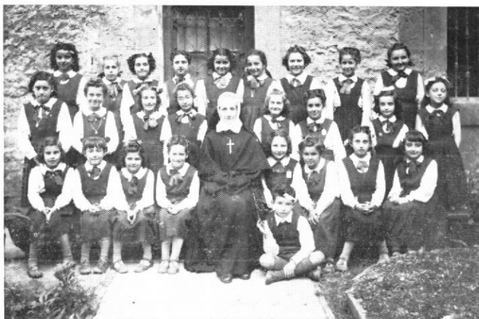
Alumnas de Aldatze.