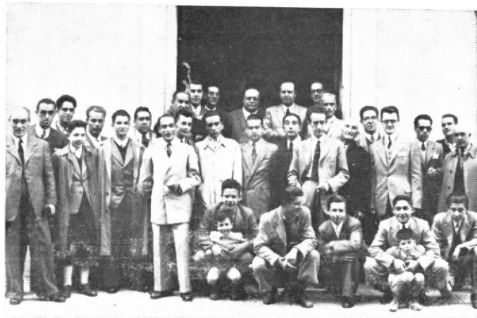
Año 1948. Empleados del Banco de San Sebastián.