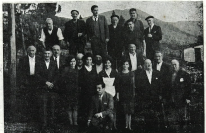
Año 1964. Los de «Peña Gorbea» en Elgueña