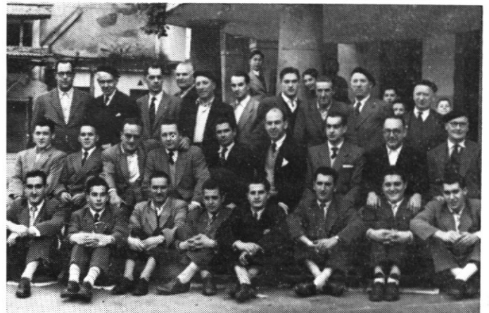
Año 1953. Músicos de una castiza Banda que amenizó muchas galas.