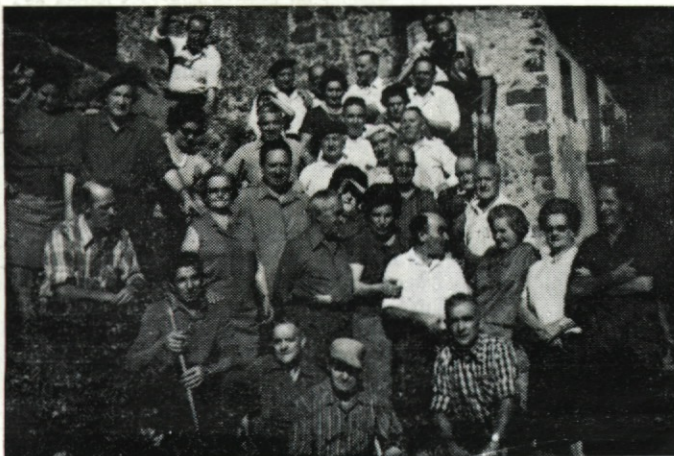
Año 1960. Mendigoizales eibarreses