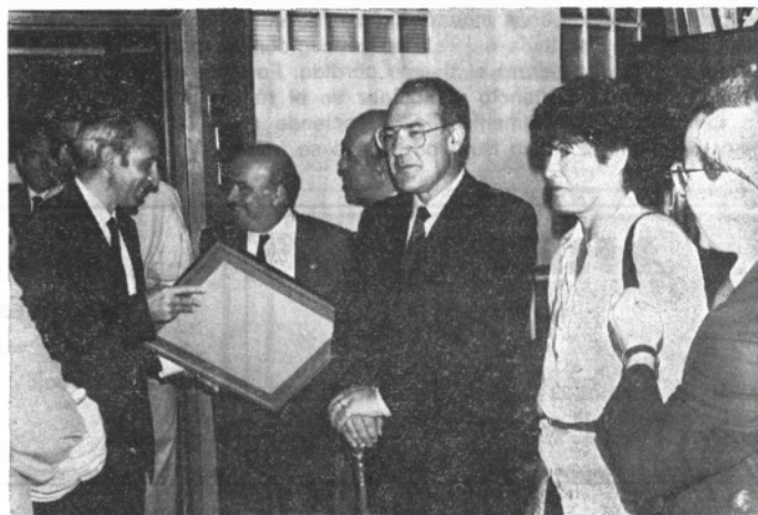
3-VII-87.— El lendakari Ardanza en la Escuela de Armería