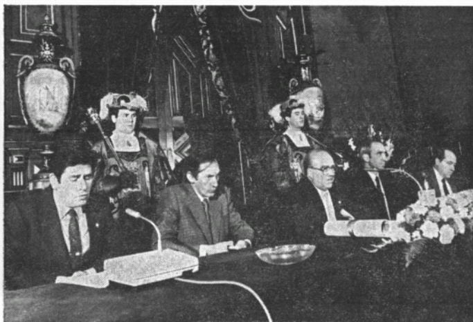
La Diputación entrega la Medalla de Oro a la Escuela de Armería

Quiero recordar, una vez más, a mi amigo el científico que me dice: «la curiosidad de la persona es la madre de la ciencia; la necesidad de la sociedad es la madre de la invención; la supervivencia de la industria es la madre de la tecnología». A esto yo añadiría: La supervivencia de la empresa es la Formación Profesional y ésta debe ser la madre de la industria».