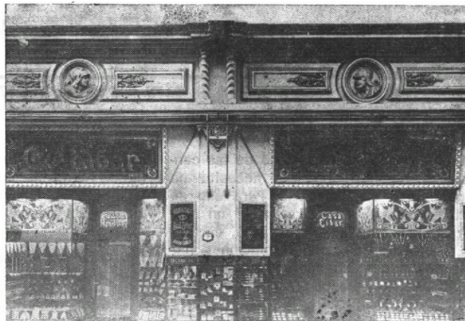
El grabado llegó hasta Argentina...

—La Escuela de Damasquinado depende del Patronato Municipal de Artes. Es éste quien costea las herramientas y todo el material necesario para el aprendizaje de los alumnos. Estos, a su vez, pagan 2.000 ptas. por mes. El importe total de los trabajos realizados por la Profesora se destinan al fondo económico de la Escuela. De la venta de los trabajos ejecutados por los alumnos, éstos se benefician del 85 por 100 de su importe. El 15 por 100 engrosa las arcas de la Escuela. Últimamente, y en razón de la urgencia de algunos trabajos, la Profesora recibe la ayuda de una alumna muy aventajada, a la que se le retribuye por horas su trabajo particular.