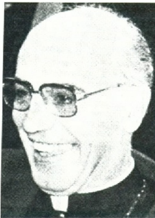
Conservador y progresista