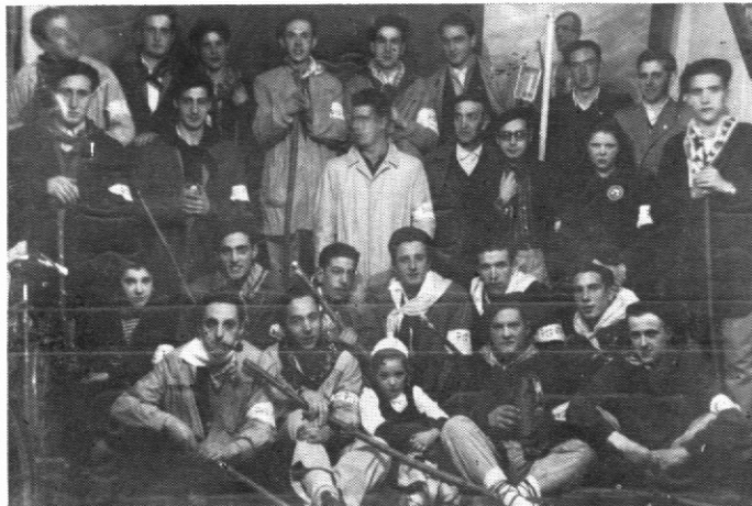
Coro de Santa Ageda