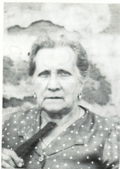
PRONTO 100 AÑOS