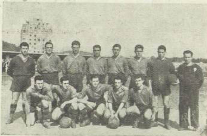
Equipo vencedor del torneo de aficionados de Gulpúzcoa.