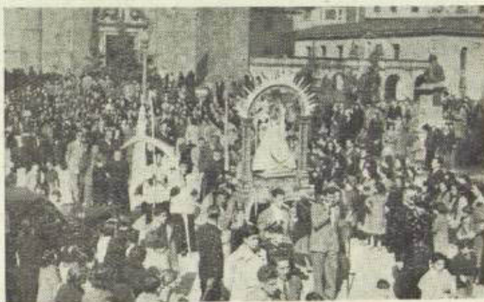
Parrokitik Ama Birgiñaz urteizen da

Eibar guztia bere Erregin maitiakn zoraturta moduan zeguan. Ta gure Ama maitia pozik irrisparrez bere semien txalo beruak arturik.