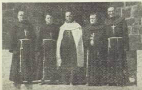
Aita Mixiolariak (batez beateak)