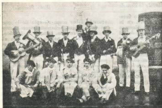
En colaboración benéfica.

Que nuestra omisión en actuar activa y eficazmente no frene el impulso de estas nobles aspiraciones. Que unidos todos hagamos realidad el que tengamos cada vez más en verdad un Eibar mejor, más justo, más social, más fraterno. En definitiva, más cristiano.