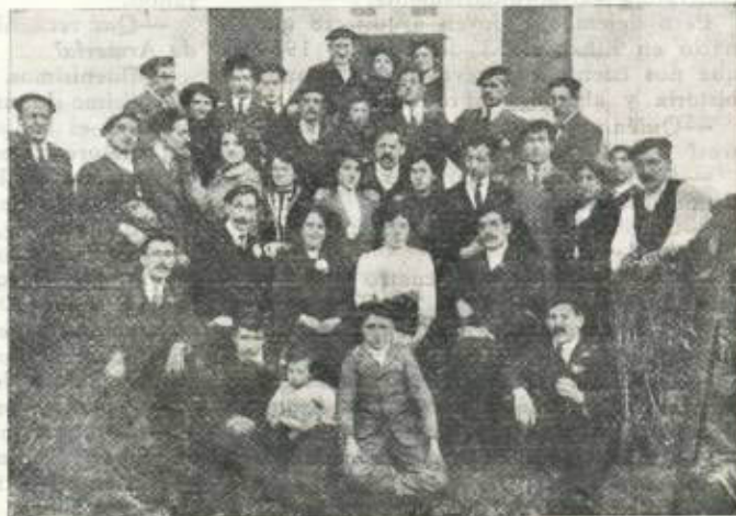
Una Comisión benéfica eibarresa de hace muchos años.