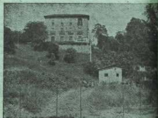
Colegio de Azitain, reconocido oficialmente. (Foto Plazaola).