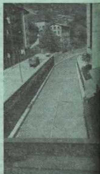
Encauzamiento y sancamiento del río.