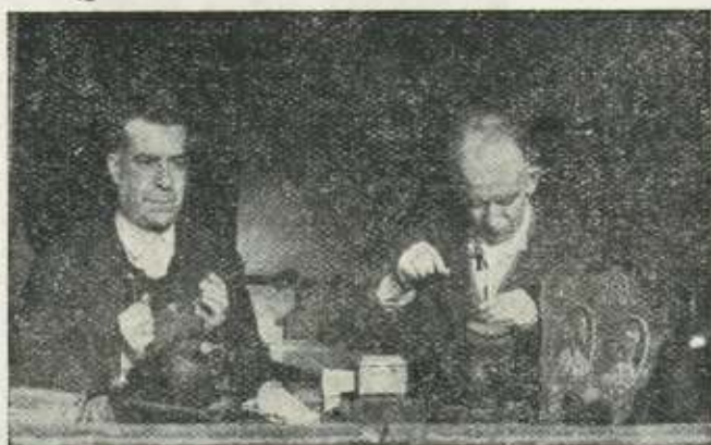
Trabajando en el damasquinado. (Foto Ojonguren).

hacían encargos de damasquinado para la Fábrica Nacional de Armas de Toledo. No había ferrocarril y la traida desde Toledo de empuñaduras y armas que se deseaban damasquinar, el trabajo y la entrega, todo esto originaba grandes demoras. Por otra parte, existían trabajos urgentes en aquella fábrica. Para salvar todos estos inconvenientes, fueron artesanos eibarreses los que llevaron el damasquinado a la Fábrica Nacio-