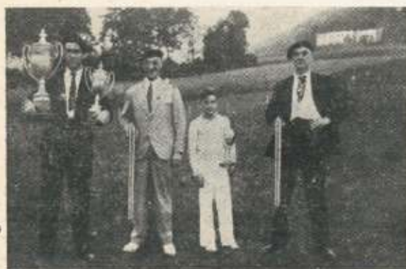
Un festejo típico de San Juan: tiro de pichón en Kamiñokua.