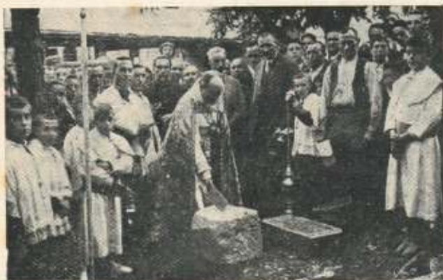
Algo agradable a San Juan: colocación de la primera piedra de la capilla del Hospital.