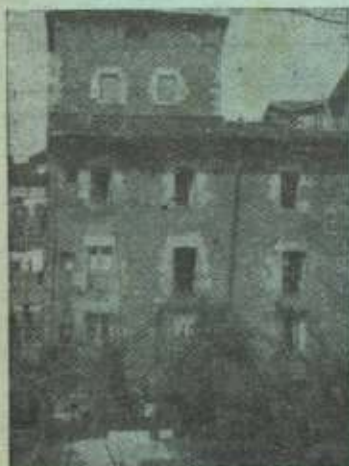
«Kontadorekua»: casa donde nació Zuloaga.