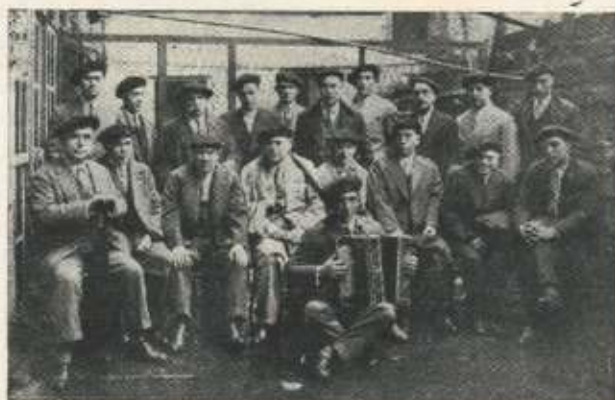
Los peluqueros que ponían elegantes al mundo masculino