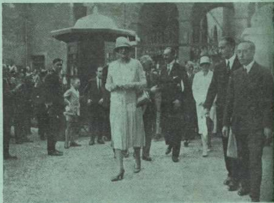
Sus Majestades el Rey Don Alfonso XIII y la Reina Doña María Cristina.