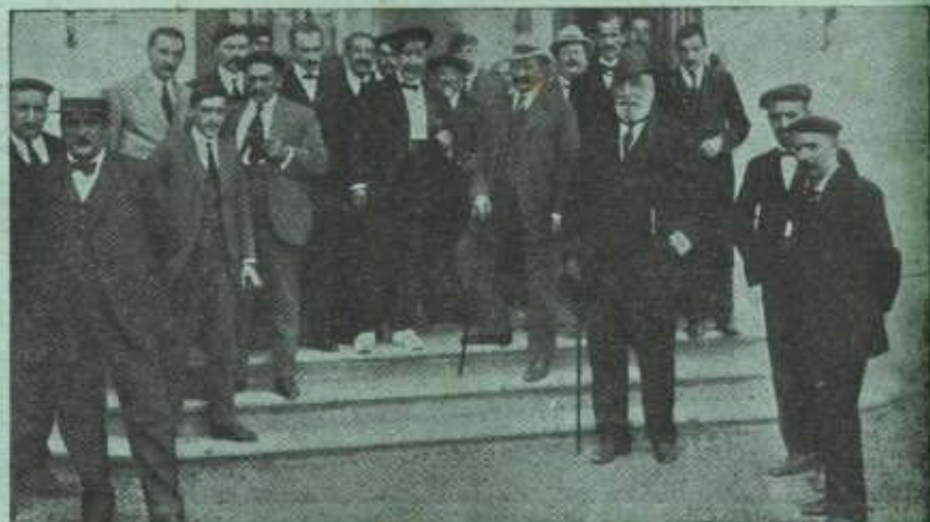
El Conde de Romanones y Fermín Calbetón.