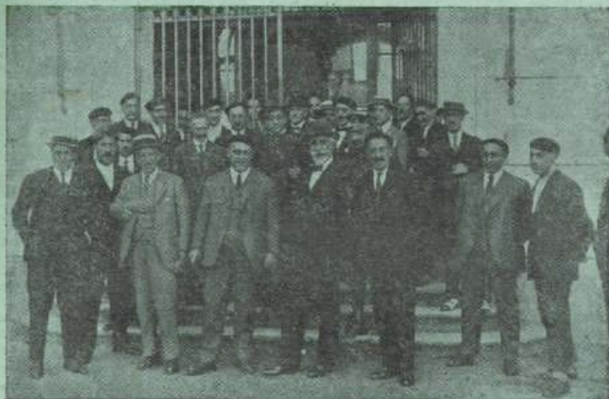
Don Antonio Maura en la Escuela de Armería.