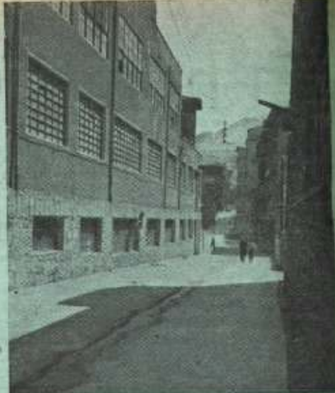
Macharia, crecido y urbanizado.