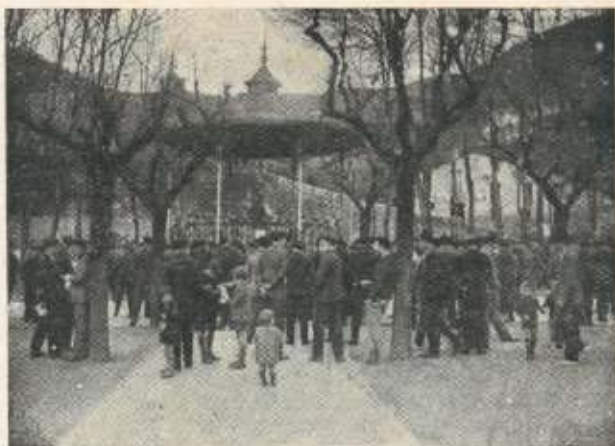
Concierto en Unzaga. En frente, el taller de Villabella.