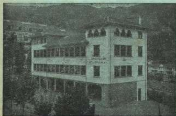
Colegio de Isasi, reconocido oficialmente.