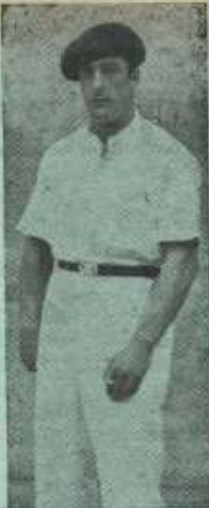
Una figura desaparecida: Chapasta.