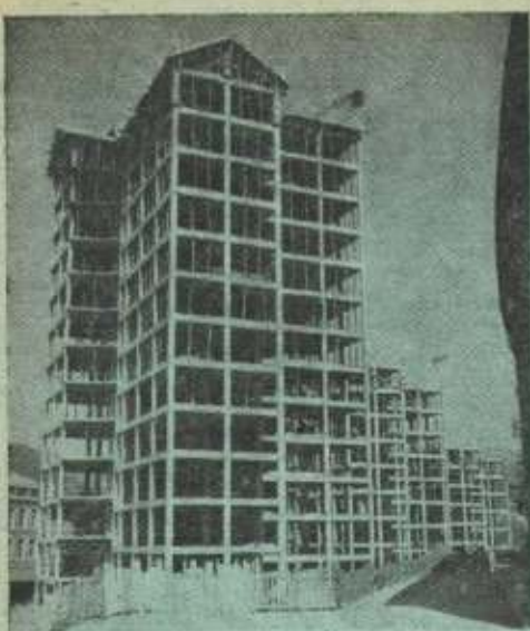
Viviendas de la I. M. E. S. A..