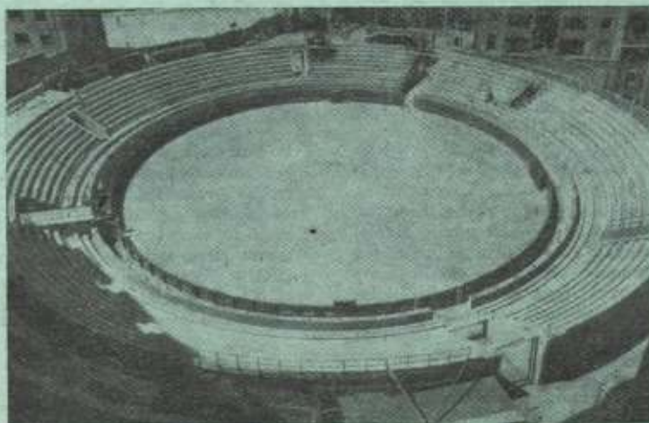
Plaza de Toros.