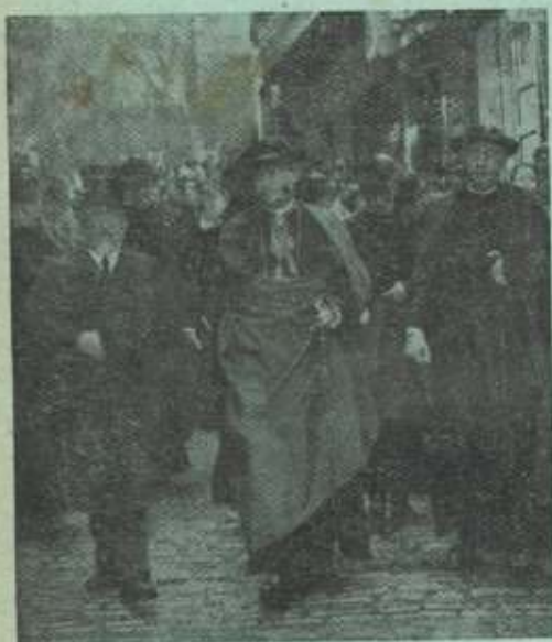
El actual Patriarca de las Indias bajando Barrenkale.