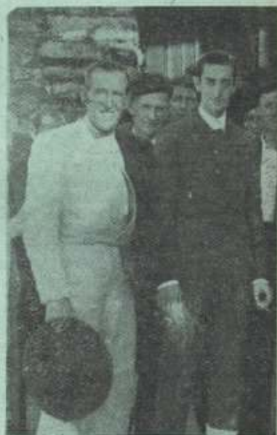
«Manolete» y «Pedrucho de Eibar» en nuestra Plaza de Toros.