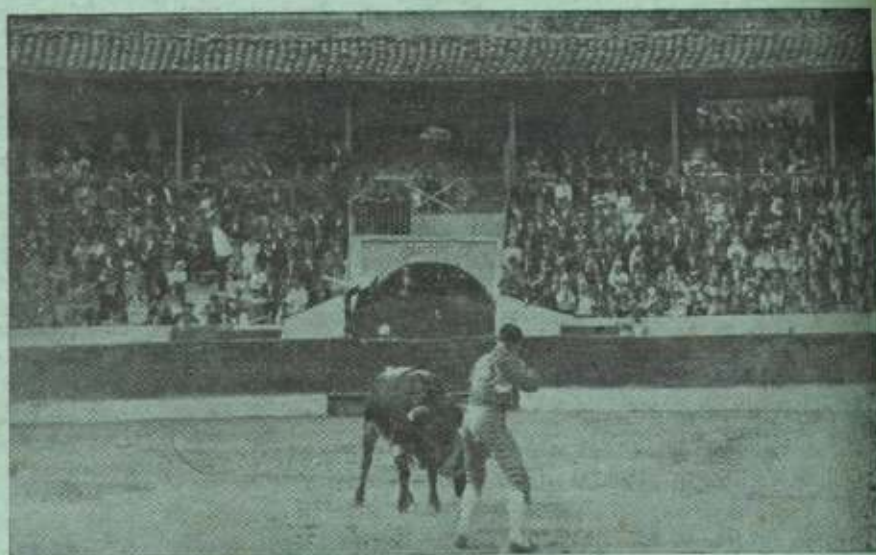
El gran matador «Achita».