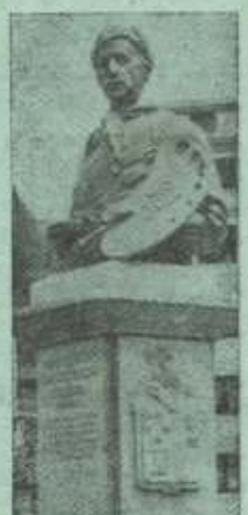
Eibar a Zuloaga.