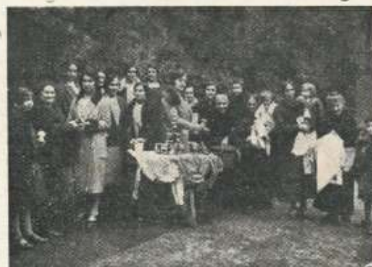
Los cimientos de la futura Caritas: el ropero de Aldatze.