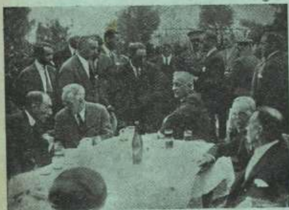
Primo de Rivera entre nosotros.