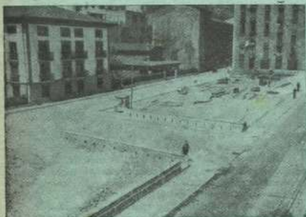
Urquizu totalmente cubierto.