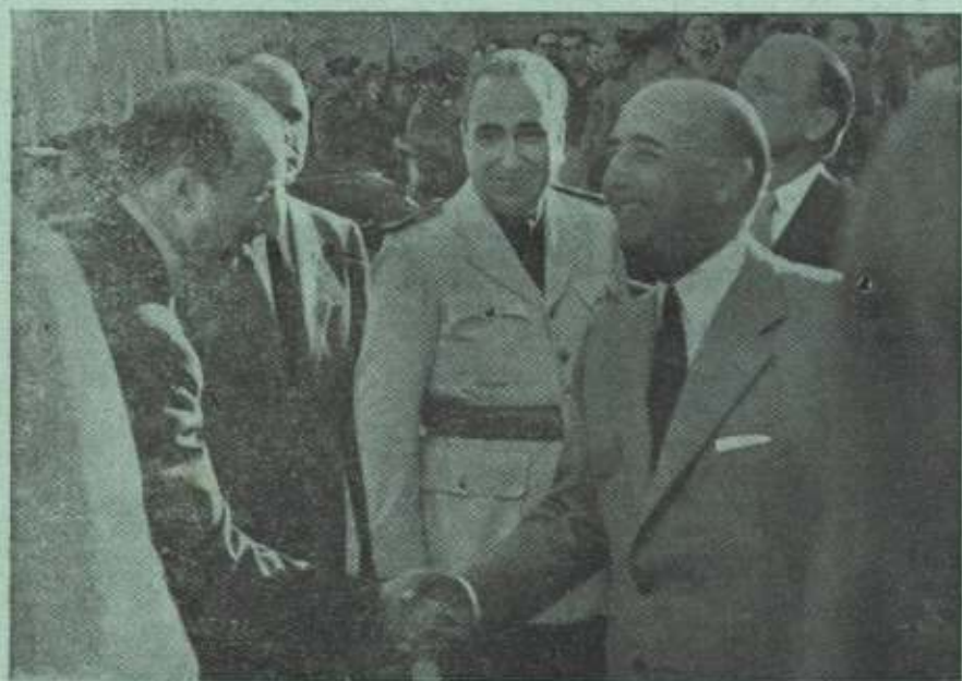
Su Excelencia el Generalísimo Franco en Ipurúa.