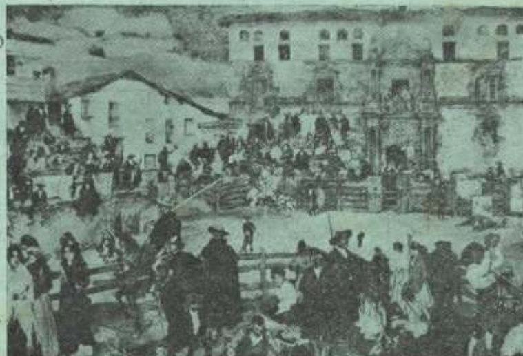
Cuadro de Zuloaga al que hace relación el artículo.