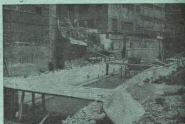
Nuevo puente de Arikitza.