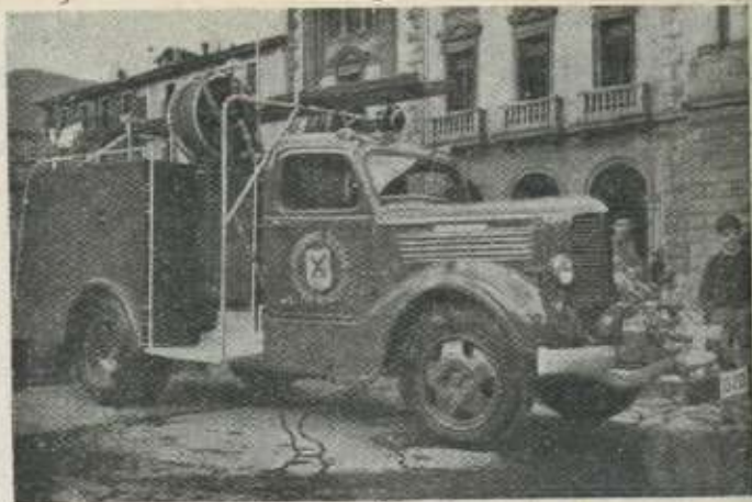
Para incendios y riego.

A estos nuevos concejales se les ha acercado nuestra Revista solicitandoles una breve entrevista en la que, fundamentalmente, se les preguntaba: SI DURANTE SU GESTION COMO CONCE-