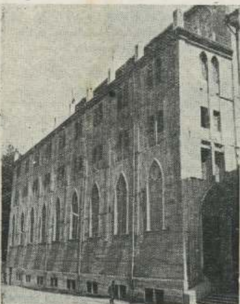
Parroquia del Carmen.