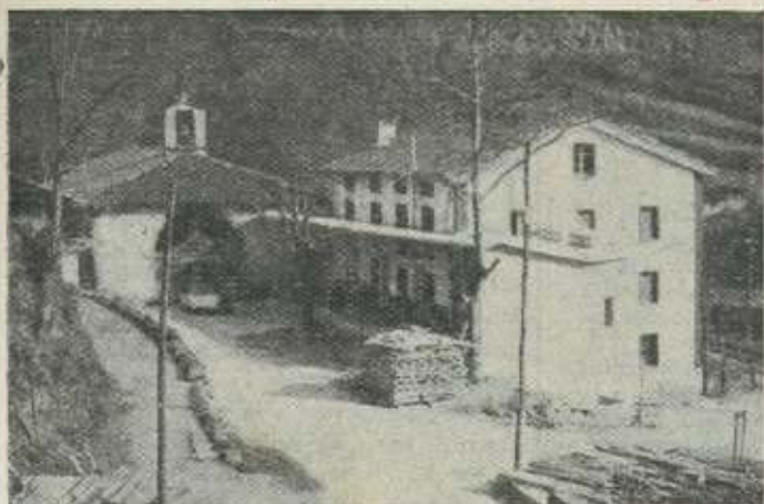
La nueva Parroquia de Azitain.