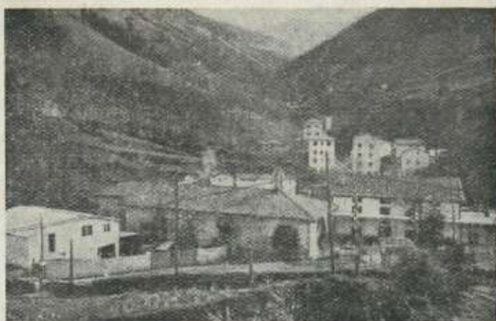
Una vista de conjunto de Azitain.