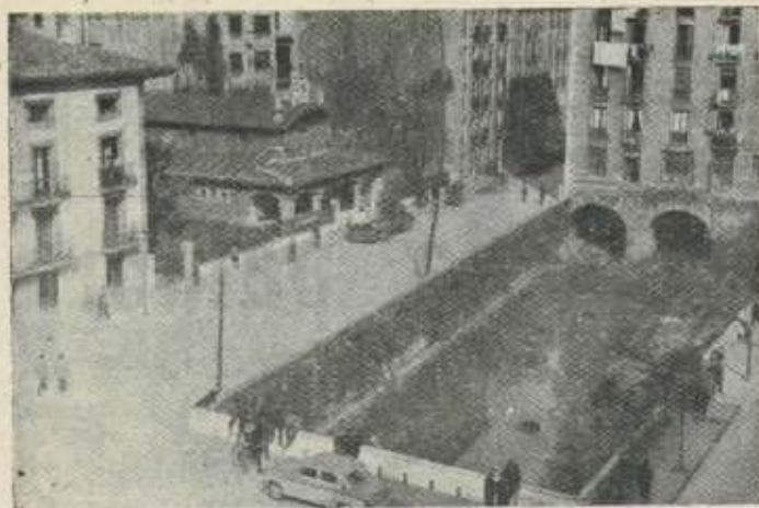
Paseo de Urquizu: así estaba hace dos años.