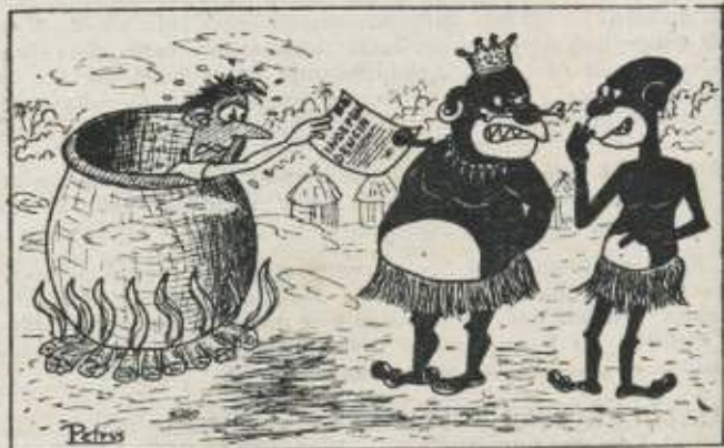
Esaixok ia nun dan berakin ekarren independenzia. Olan bixak batera jango jitsuagu.