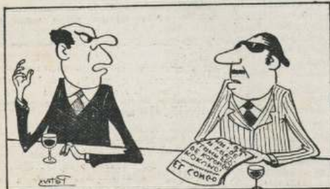
Orrek Kongo aldeko ba'tzok penstaszen juck zibilizauta darelá; baña, Real Madrixa juango balitzakék, ordu erdixan amarren bat gof sartuko laitzukiek.