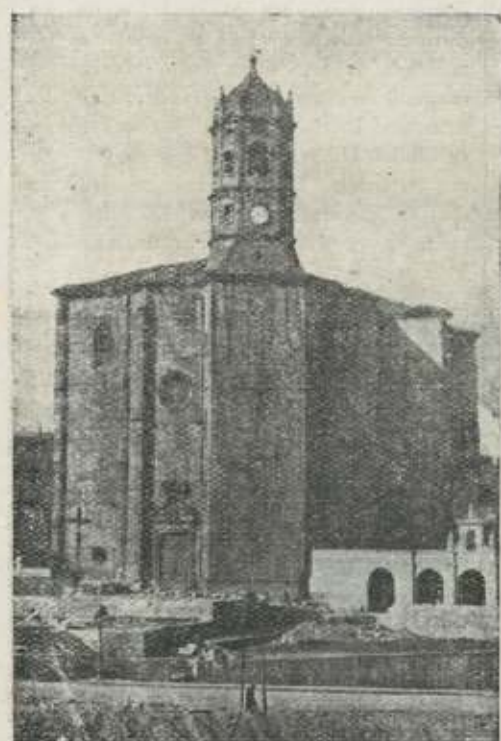
Parroquia de San Andrés.