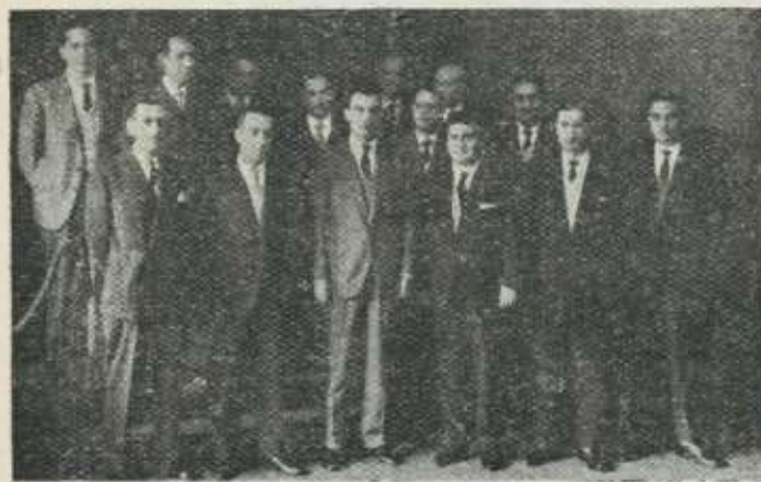
La actual corporación municipal.

Nuestra felicitación al Ayuntamiento y nuestro deseo de que — en este sentido — se realicen rápidamente todos los proyectos en cartera.